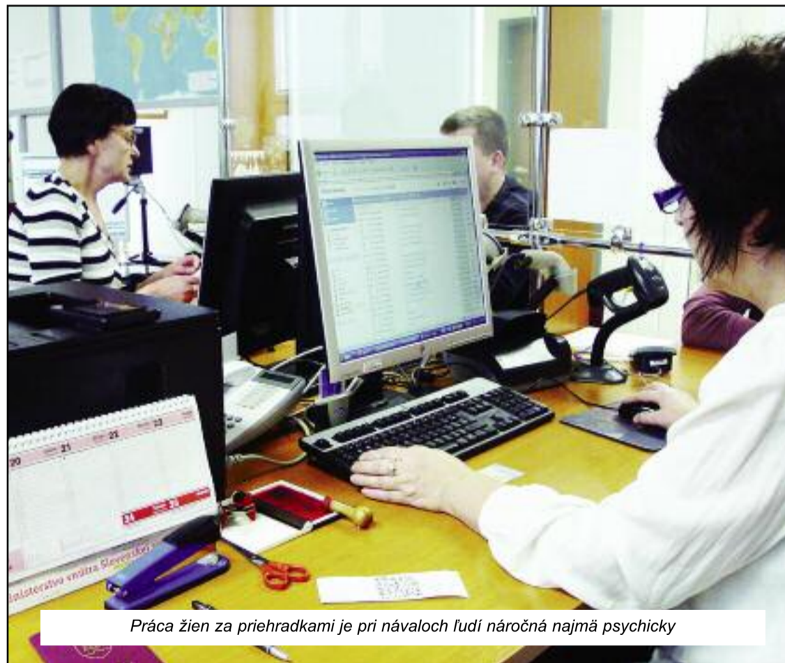
Práca žien za priehradkami je pri návaloch ľudí náročná najmä psychicky

Tak sa téma dostala aj na odborársku pôdu, keď o celoslovensky vážnej situácii diskutovalo aj predsedníctvo OZP v SR. Problém sme v skratke priblížili v decembrovom vydaní POLÍCIA, pričom sme informácie získavali od našich predsedov krajských rád. A tiež sme slúbili, že sa k téme ešte vrátíme, pretože novembrové prekypanie trpezlivosti žien za prepážkami oddelení dokladov po celom Slovensku ukázalo, že ide o vrchol ľadovca. Problémov, ktoré čakajú na riešenie, sa naozaj nakopilo veľa.