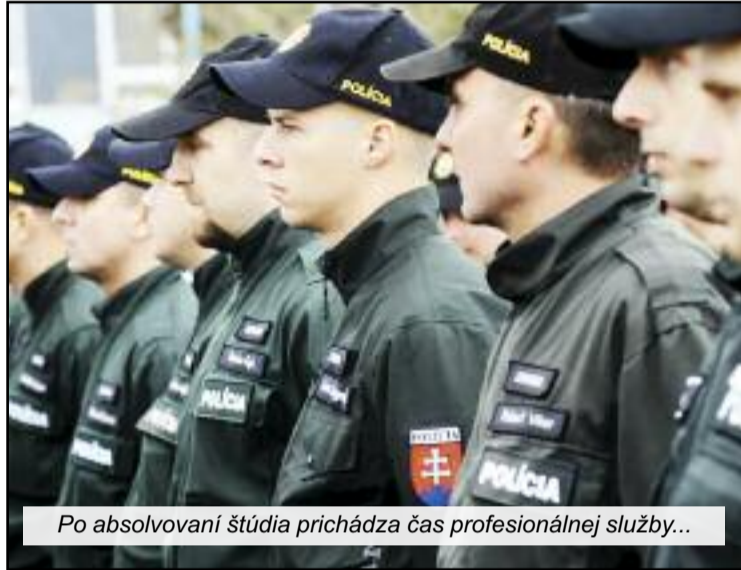
Po absolvovaní štúdia prichádza čas profesionálnej služby...