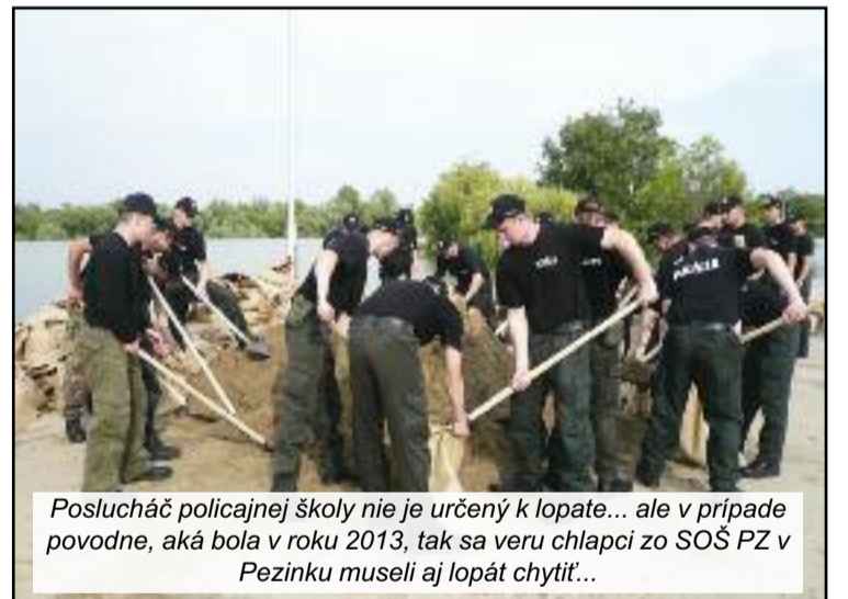
Poslušáček policajnej školy nie je určený k lopate... ale v prípade povodne, aká bola v roku 2013, tak sa veru chlapi z SOŠ PZ v Pezinku museli aj lopát chytiť...