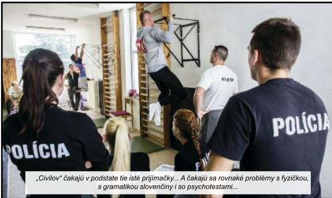
„Civilov“ čakajú v podstate tie isté prijímačky... A čakajú sa rovnaké problémy s fyzikou, s gramatikou slovenčiny i so psychotestami...