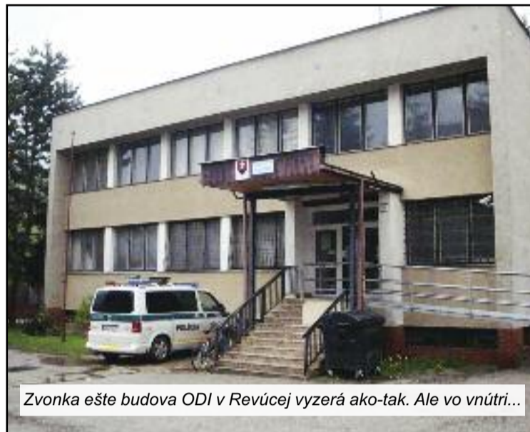
Zvonka ešte budova ODI v Revúcej vyzerá ako-tak. Ale vo vnútri...

potrebné urobiť komplexne a kvalitne. Žiadali už veľakrát prostredníctvom bansko-bystrického centra podpory, zatiaľ