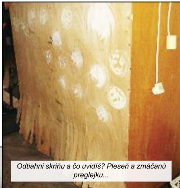
Odtiahni skriňu a čo uvidíš? Plesneň a zmáčanú preglejku...