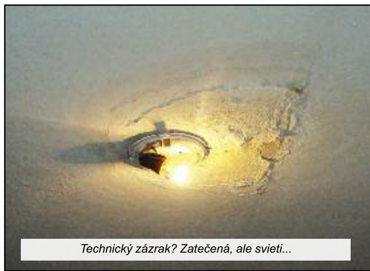
Technický zázrak? Zatečená, ale svieti...