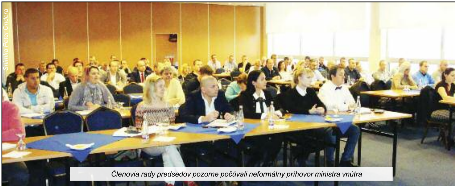
Členovia rady predsedov pozorne počúvali neformálny príhovor ministra vnútra