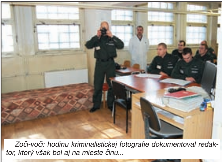
Zoči-voči: hodinu kriminalistickej fotografie dokumentoval redaktor, ktorý však bol aj na mieste činu...

rokokoch 2005 a 2006 prezídium PZ hľadalo spôsob, ako zabezpečiť vzdelávanie kriminalistických technikov. Košická SOŠ PZ sa rozhodla prijať túto výzvu a dnes už je jasné, že to bolo rozhodnutie veľmi dobré pre kvalitu prípravy kriminalistických technikov, a teda