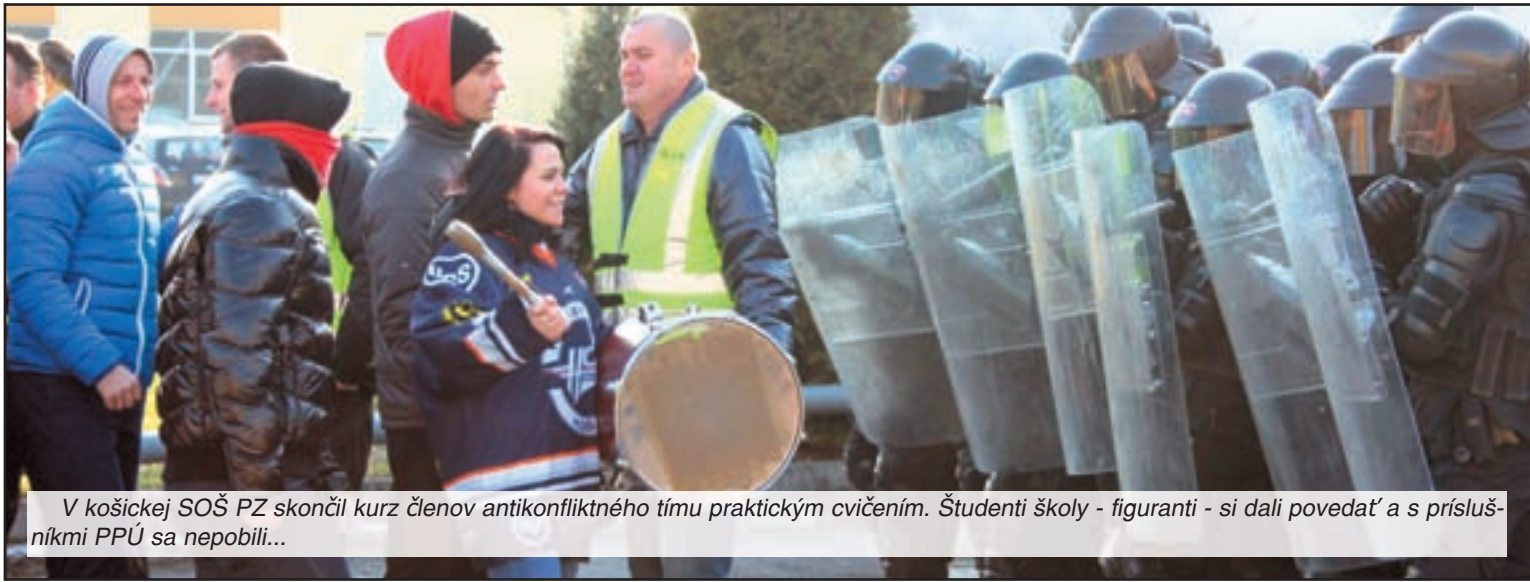
V košickej SOŠ PZ skončil kurz členov antikonfliktného tímu praktickým cvičením. Študenti školy - figuranti - si dali povedať a s príslušníkmi PPÚ sa nepobili...