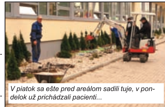
V piatok sa ešte pred areálom sadili tuje, v pondelok už prichádzali pacienti...

PS: Škoda len, že organizátori slávnostného otvorenia nepovažovali za potrebné pozvať na túto významnú udalosť aj zástupcu vedenia Odborového zväzu polície