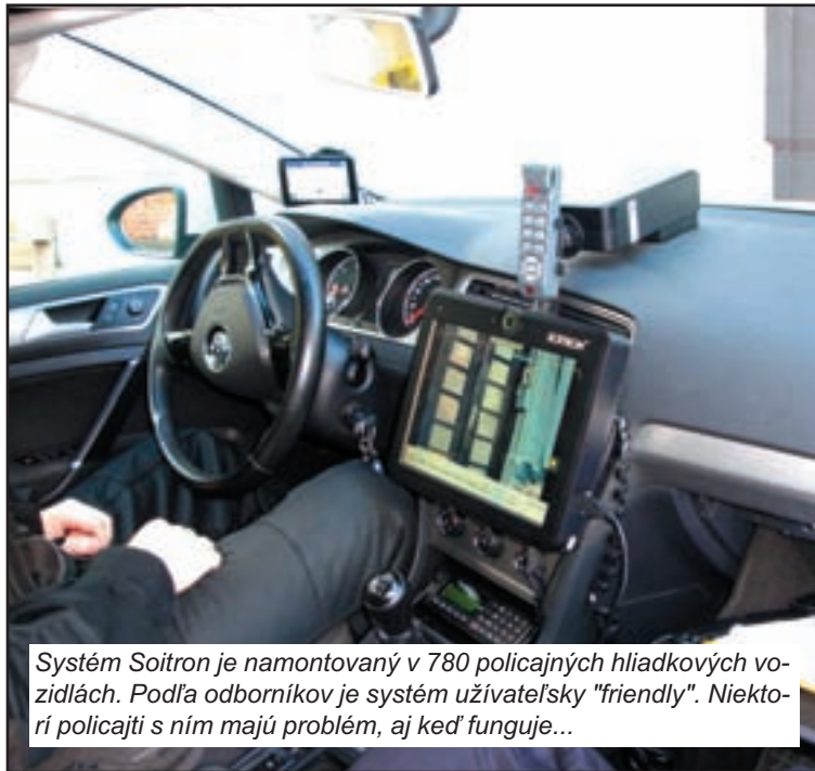
Systém Soitron je namontovaný v 780 policajných hliadkových vozidlách. Podľa odborníkov je systém užívateľsky „friendly“. Niektorí policajti s ním majú problém, aj keď funguje...

Pre tých, čo ešte o „inteligentných autách“ veľa nevedia, priblížme základné funkcie. S vybavením „A“ má policajt k dispozícii navigačný systém GPS, AVL a kameru s digitálnym záznamom. Ďalej má policajt možnosť priamo vo vozidle cez integrovanú čítačku v monitore s dotykovou obrazovkou lustravať osobné doklady i doklady od vozidla, môže tak získať o vodičovi všetky informácie – vrátane platnosti emisnej kontroly či úhrady povinného