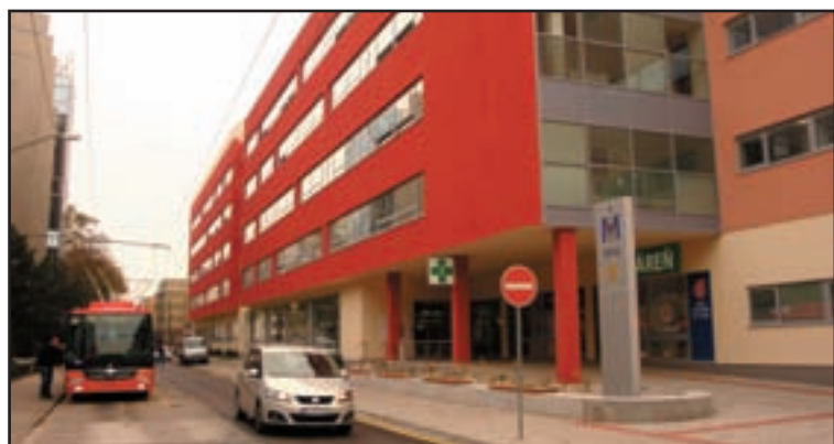
Nemocnica v centre mesta je obkolesená úzkymi komunikáciami s hustou dopravou. Budú mať sanitky a vlastnými autami prichádzajúci pacienti problémy?

Brány areálu sa v tichosti, takpovediac predpremiérovu otvorili