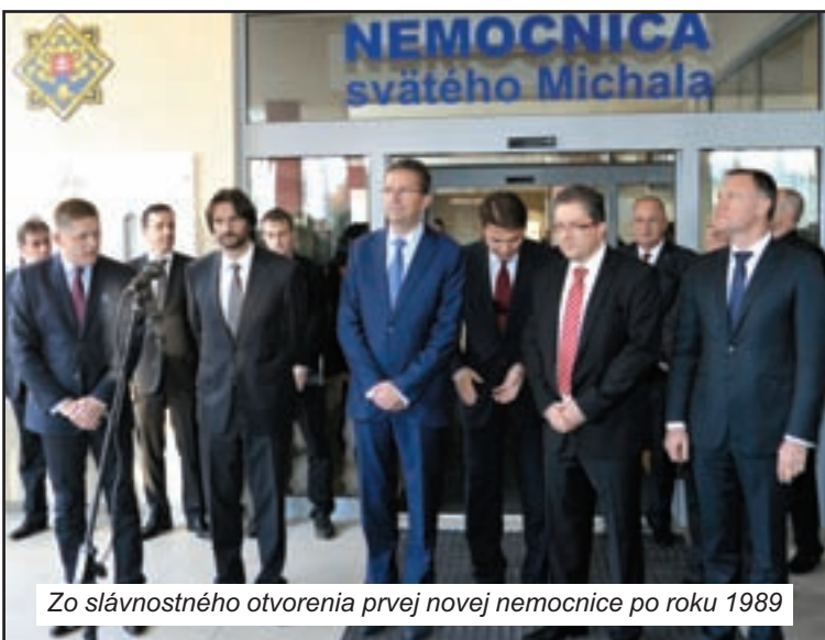
Zo slávnostného otvorenia prvej novej nemocnice po roku 1989

Pamätníci vedia, že nemocnica mala stáť už dávnejšie, peniaze na ňu malo ministerstvo vnútra „odklepnuté“ už za prvej vlády R. Fica, ale striedajúca vláda Ivety Radičovej pripravenému projektu