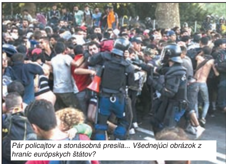
Pár policajtov a stonásobná presila... Všetdejúci obrázok z hraníc európskych štátov?

je možné vynútiť si zvonka zmenu kultúrnych vzorov, či prijme paralelné spoločenstvá alebo či si ochránime tolerantný životný štýl