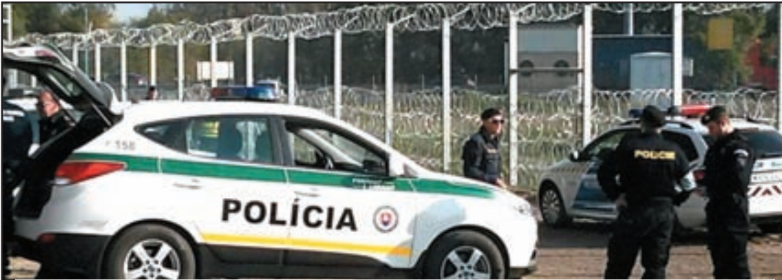
Po roku 1989 sú znova na hraniciach niektorých európskych štátov osnaté zátarasy. Slovenskí a českí policajti slúžia aj na maďarsko–srbskej hranici... Taká je doba?

Slovenskí policajti pomáhajú na maďarsko–srbskej hranici. Policajti sú velení do peších aj mobilných hliadok spolu s maďarskými kolegami v 12–hodinových intervaloch. V niektorých hliadkach sú podľa potreby zaradení aj vojaci maďarskej armády. Úsek, na ktorom vykonávajú hliadkovú službu, je dlhý približne 40 km. Monitorujú terén, pátrajú po nelegálnych migrantoch, koordinujú činnosť s ostatnými zložkami.