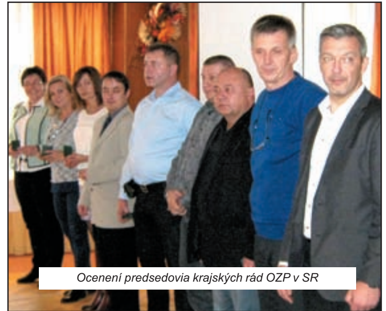
Ocenení predsedovia krajských rád OZP v SR