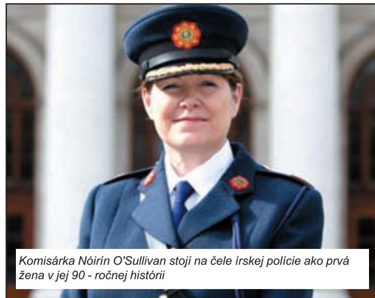
Komisárka Nóirín O'Sullivan stojí na čele irskej polície ako prvá žena v jej 90 - ročnej histórii