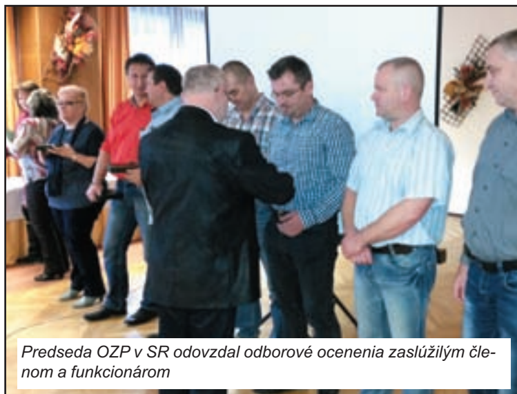
Predseda OZP v SR odovzdal odborové ocenenia zaslúžilým členom a funkcionárom

súčasnosti, povedal prezident, predstavuje rozpracovanosť 12 spisov na vyšetrovateľa pri poklese o 1,2 oproti roku 2014. Najviac (15,45) majú vyšetrovatelia v Bratislavskom kraji, najmenej (9,56) Žilincami, ostatné kraje sa pohybujú na úrovni desiatich spisov. V