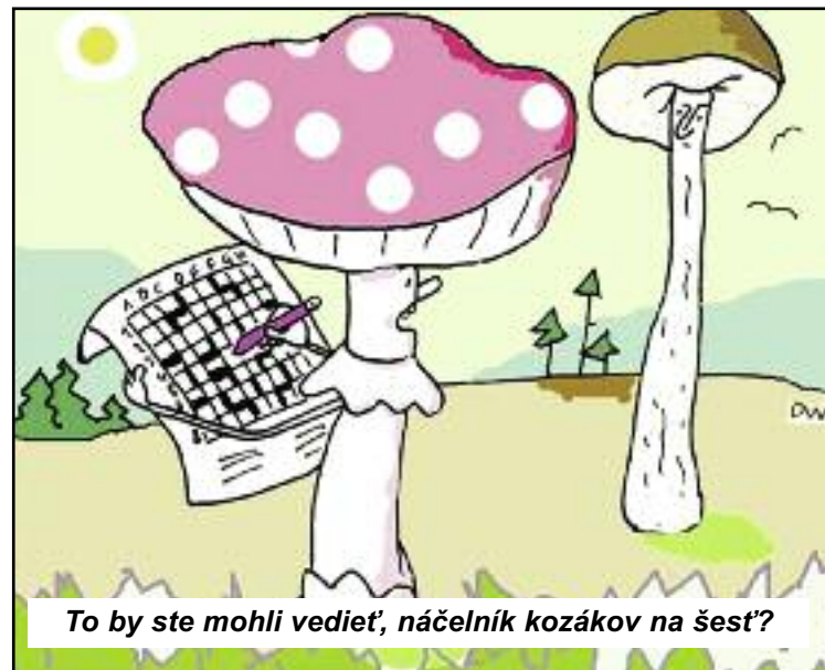
To by ste mohli vedieť, náčelník kozákov na šest'