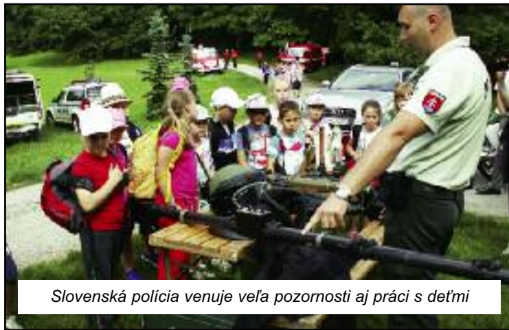
Slovenská polícia venuje veľa pozornosti aj práci s deťmi

nemuseli riešiť do budúcnosti, kto a čo má robiť – počnúc styčnými osobami medzi centrami podpory a KR PZ. Zatiaľ je situácia taká, že súčinnosť je niekde prakticky bezproblémová, napríklad v Nitre, inde sa názory napríklad na rýchlosť služieb dosť líšia. Samozrejme, podľa mňa sú tieto problémy riešiteľné z oboch