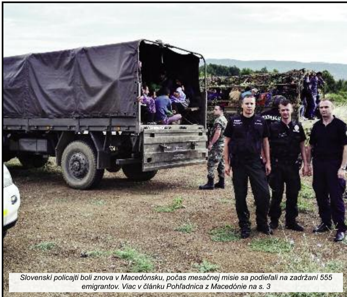
Slovenskí policajti boli znova v Macedónsku, počas mesačnej misie sa podieľali na zadržaní 555 emigrantov. Viac v článku Pohľadnica z Macedónie na s. 3