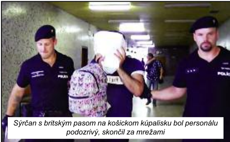
Sýrčan s britským pasom na košickom kúpalisku bol personálu podozrivý, skončil za mrežami

technickú prehliadku kúpaliska. Z „tmavšieho“ chlapa sa podľa policajných správ vykľul 36-ročný Sýrčan, ktorý mal platný britský pas a bol na leteckej ceste z Ukrajiny do Bristolu, v Košiciach čakal na ranné lietadlo. Z bezpečnostné hľadiska vraj nepredstavoval pre Slovákov nijaké riziko, hoci policajné zdroje na-