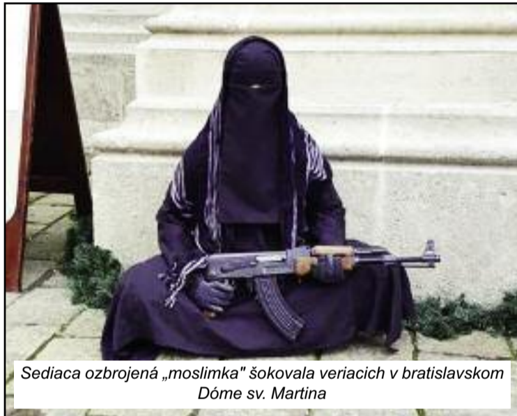
Sediaca ozbrojená „moslimka“ šokovala veriacich v bratislavskom Dóme sv. Martina

značili, že jeho časté putovania na trase východ – západ veľmi nemajú logické vysvetlenie. Navyše, oficiálne nevinnému britskému Sýrčanovi po noci stráve-