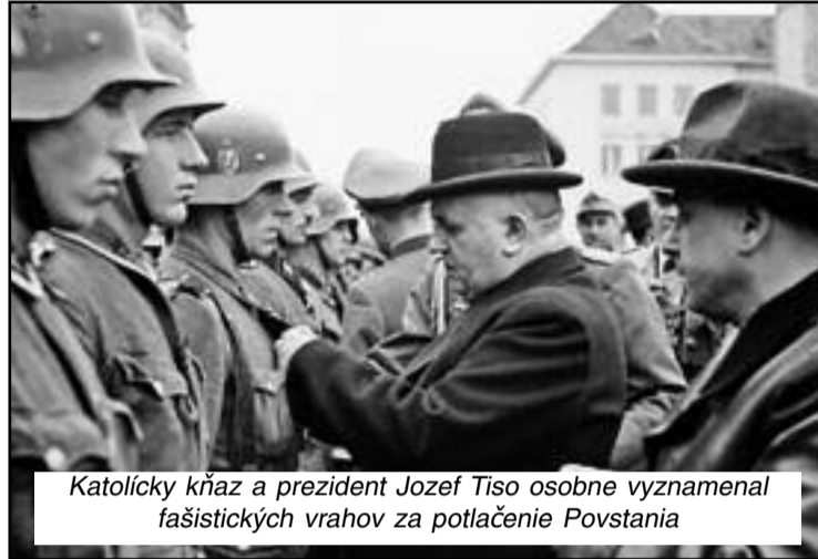
Katolícky kňaz a prezident Jozef Tiso osobne vyznamenali fašistických vrahov za potlačenie Povstania