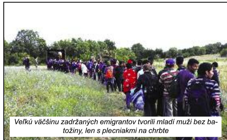
Veľkú väčšinu zadržaných emigrantov tvorili mladí muži bez batôžiny, len s plecniakmi na chrbte