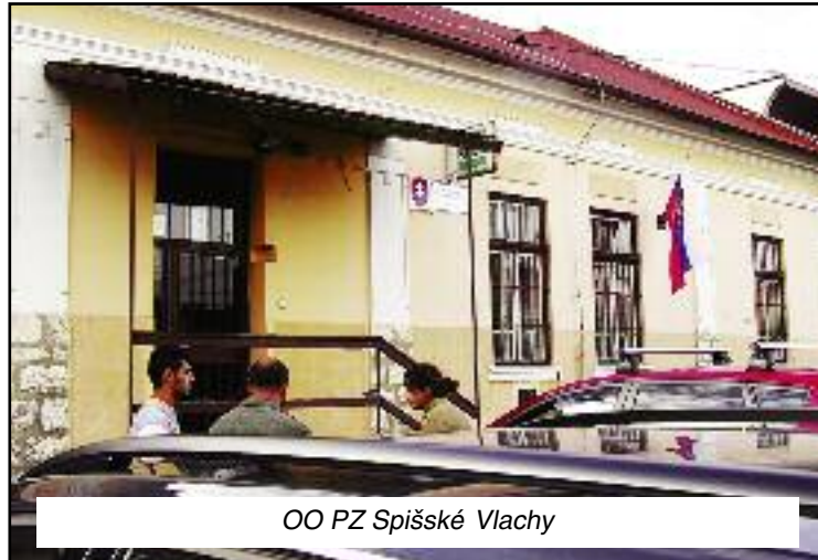
OO PZ Spišské Vlachy