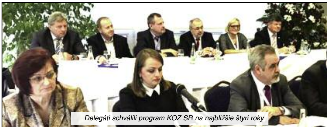
Delegáti schválili program KOZ SR na najbližšie štyri roky

S predsedom OZP v SR po návrate z riadneho zasadania výboru EuroCOP-u