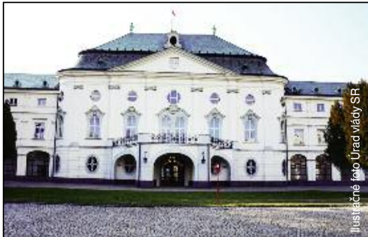
Ilustračné foto Úrad vlády SR

verejnom záujme s výnimkou pedagogických a odborných zamestnancov a učiteľov vysokých škôl o 4% aj od 1.januára 2018.