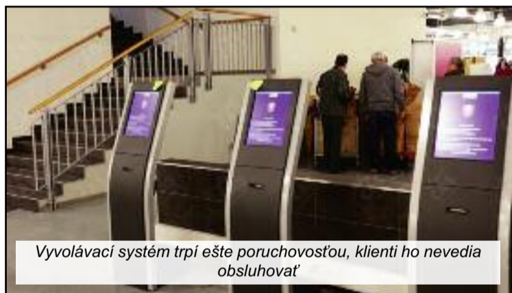
Vyvolávací systém trpí ešte poruchovosťou, klienti ho nevedia obsluhovať