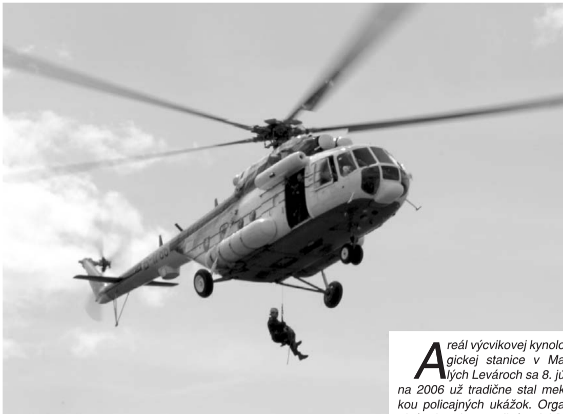
Možno prileť aj vrtuľník... a prileteť!