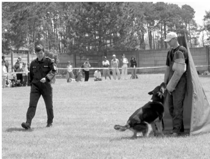
Pekne stoj a nepohni sa!