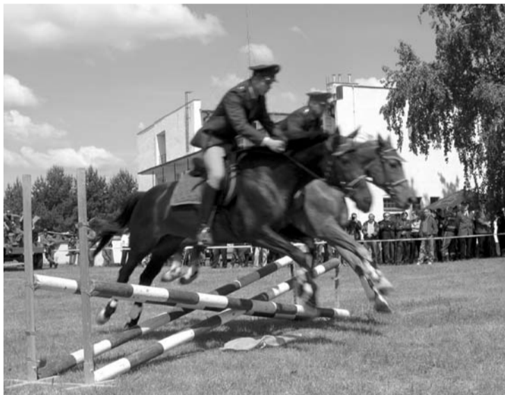
Jazdecká polícia ukázala, že sa ničoho neboja ani príslušníci, ani ich kone