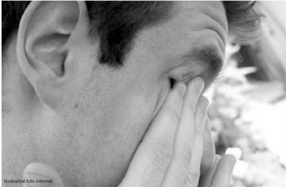
Ilustračné foto internet

(Pokračovanie: Mobing a špeciálna policajná služba)