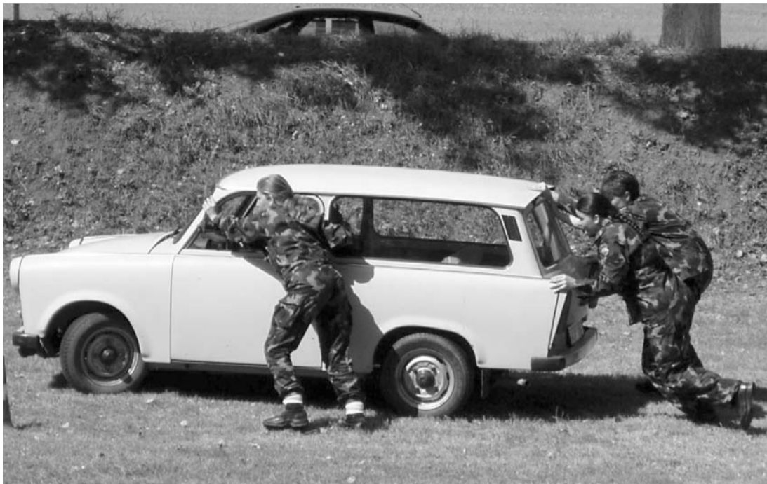
Súťaž v tlačení nesmrteľného auta zn. Trabant...

V dňoch 16. až 20. augusta 2006 sa štyria členovia územnej úradovne IPA Prievidza na základe oficiálneho pozvania už tretíkrát zúčastnili medzinárod-