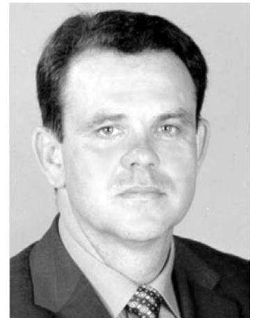
Mgr. JOZEF BUČEK

2002 – 2006 – člen Výboru NR SR pre obranu a bezpečnosť, Osobitného kontrolného výboru NR SR na kontrolu NBÚ, Osobitného kontrolného výboru NR SR na kontrolu činnosti Vojenského spravodajstva