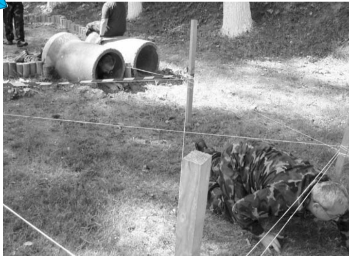
Pri tejto disciplíne sú dôležité miery...

Ďalšie informácie na adrese: OZP v SR, Pribinova 2, 810 72 Bratislava alebo na intranetovej stránke pod našou hlavičkou, e-mail: ozpvsr@minv.sk, tel: 09610/51950, 58 fax: 09610/59096