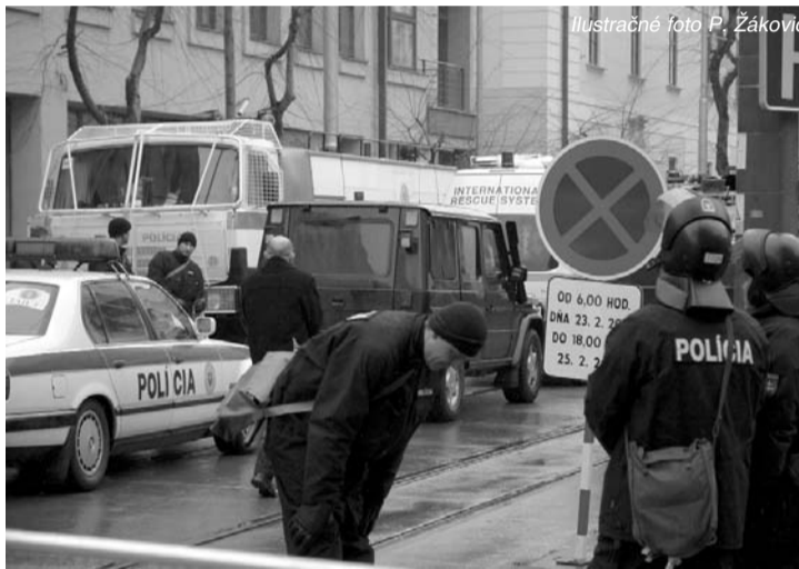
Ilustračné foto P. Žakovič

čania trpia fluktuáciou odborníkov, ktorí odchádzajú do špecializovaných súkromných servisov, kde je jednoduchšia práca, vyššia pláca a najmä sú tam utvorené lepšie pracovné podmienky, pretože sa orientujú len na isté typy vozidiel, sú vybavené súčiastkovou základňou, špecializovanou diagnostikou, prípravkami, špeciálnym náradím... V rezortnej opravovni musí byť mechanik doslova v šeu-