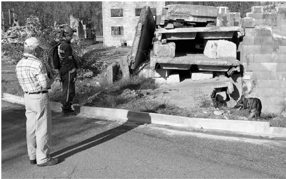
Švajčiari postavili na výcvik umelé ruiny...

mády, najmä ženistov zabezpečujúcich ochranu civilného obyvateľstva), ktoré im môžeme úprimne závidieť. Umelo postavené „ruiny“, v ktorých môžu pyrotechnici zakladať riadené požiare, zadymenia či výbuchy simulujúce bombardovanie či následky zemetrasenia, sú prepomené dômyselnými, rôzne prepomenými podzemnými chodba-