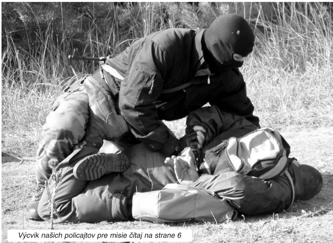
Výcvik našich policajtov pre misie čítaj na strane 6

V EuroCOP–e pribudli noví členovia: českí a rumunskí kolegovia