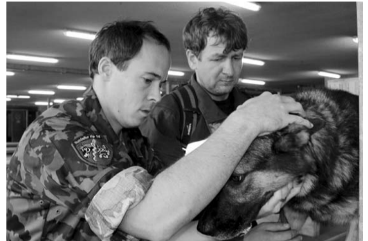
Pes Moris ťažko ochorel akurát na súťaži...

bruž z OR PZ Rožňava so SP Hykom Polícia – Slovakia 59. miesto (pričom bol vyhodnotený ako druhý najlepší pes v disciplíne poslušnosti a ovládateľnosti. Morisa ošetril miestny vojenský veterinárny lekár, ktorý mu po aplikovaní príslušných injekcií odporučil „pokoj na lôžku“, takže sa v celkovom hodnotení ocitol na 15. mieste. Aj táto disciplína bola divácky veľmi príťažlivá. Služobné psy vyhľadávali zavalené a zasypané osoby v malom mestečku (špeciálne postavenom pre výcvik švajčiarskej ar-