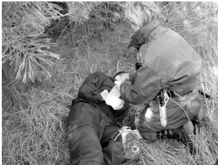
Znalosť prvej pomoci je samozrejmosťou

nostnej a obrannej politiky Európskej únie na základe uznesenia vlády SR od roku 2002. Dnes si získané vedomosti overovali v praxi – priamo v teréne. V priestore vojenského výcvikového priestoru Záhorie, tzv. „Široká“