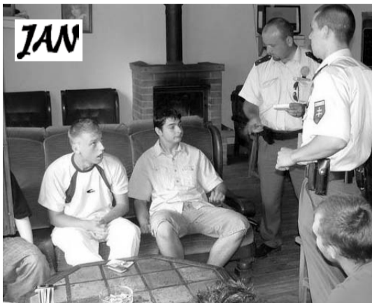
Policajné kontroly v pohostinských zariadeniach majú mať viac preventívny účinok.

Krajské riaditeľstvo Policajného zboru v Prešove aktívne spolupracuje aj s policiami okolitých štátov. Medzi štáty, s ktorými sa spolupráca realizuje, patrí aj Holandské kráľovstvo a to v rámci projektov MATRA a MATRA II. Sú to projekty s celoslovenskou pôsobnosťou. Na základe tejto spolupráce v súčasnosti KR PZ realizuje jeden z projektov pod názvom JAN, ktorý vychádza z projektu Holandskej kráľovskej polície s názvom „BOB“. U nás bude realizovaný pod názvom „J A N“, čo v skratke znamená JA – NEPIJEM.