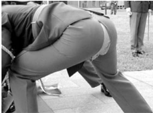
Dopadneme nakoniec takto?

104. o zriadení odbornej komisie Policajného zboru na vykonanie skúšok odbornej spôsobilosti príslušníkov obecnej polície v Liptovskom Mikuláši