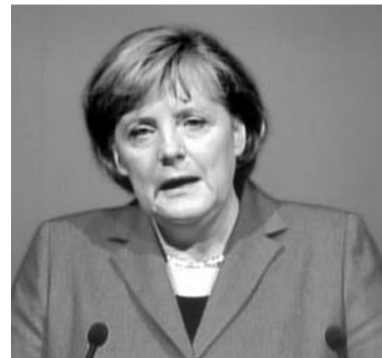
Pani kancelárka Merkelová si počas svojho prejavu na kongrese musela vypočuť aj piskot...

pečím/rizikom v povolani? Stále častejšie sa policajti stávajú obetami násillia. Policajné zákro-