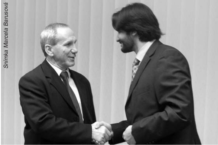
Dobrá vôľa oboch strán zatiaľ, zdá sa, nechýba...