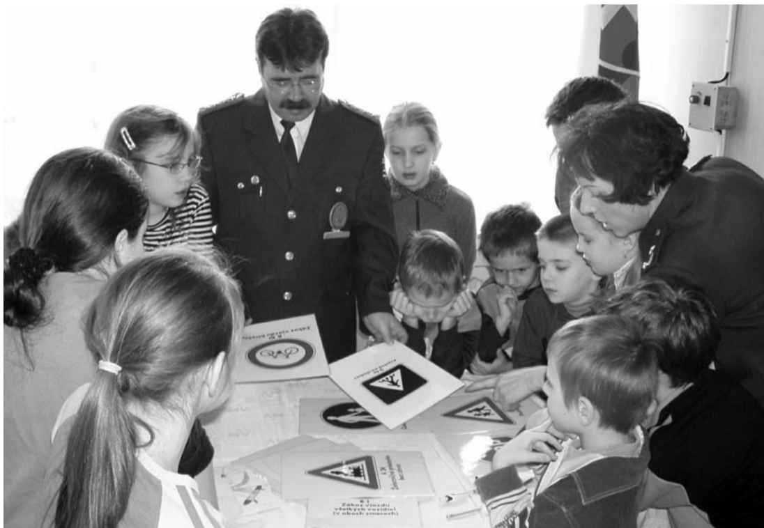
S prevenciou je potrebné začať od útleho detstva. Viac na strane 7