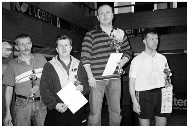
Muži nad 35 rokov – aj táto cena išla za hranice...