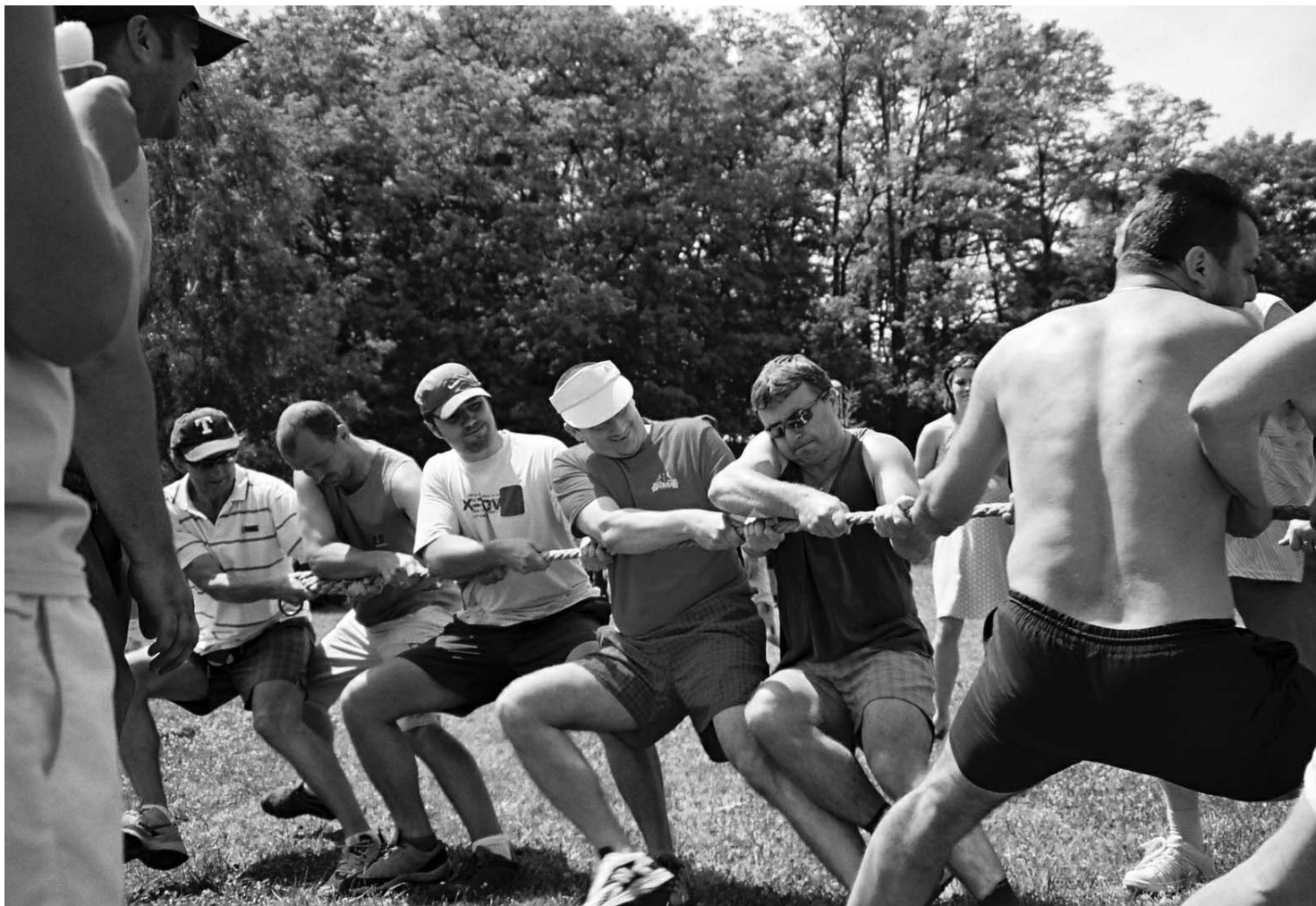
Jún v rezorte vnútra – to je aj množstvo atraktívnych podujatí, organizovaných pre deti i dospelých. Redakcia navštívila dobre pripravenú akciu trnavskej základnej organizácie OZP na kúpalisku v Páci. Policaisti si tu o. i. vyskúšali, aké to je, keď všetci ťahajú za jeden povraz, ale rovnako usilovne ťahajú aj tí z druhej strany... Viac na strane 6.

väčšinu návrhov a pripomienok OZP spracovatelia akceptujú. Do prípravných prác sú zapojení (Pokračovanie na strane 2)