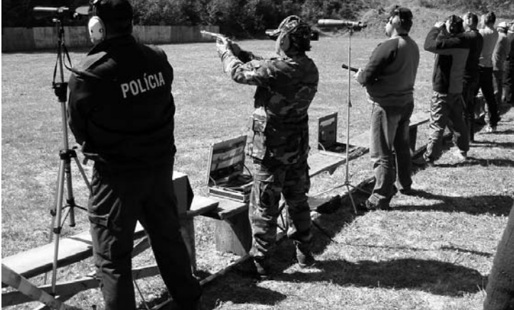
Strelci na čiare

Na strelnici v obci Pača, okr. Rožňava sa uskutočnil 1. ročník streleckej súťaže z veľkokalibrových zbraní jednotlivcov a družstiev „O putovný Pohár predsedu ZO OZP Rožňava“, ktorý zorganizovala ZO OZP 10-08 Rožňava v spolupráci s OR PZ Rožňava, Obecným úradom Pača a ŠSK Pača.