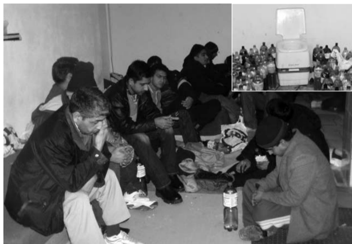
Tieto otrasné policajné zábery vznikli z bratislavského úkrytu, v ktorom prevádzka nechal "bývať" skupinu utečencov. Kiežby sme sa na našom území v budúcom roku stretávali s podobnými zábermi čo najmenej... (on)

sunie k poriadkovej polícii prípadne k monitorovaniu zelenej hranice.