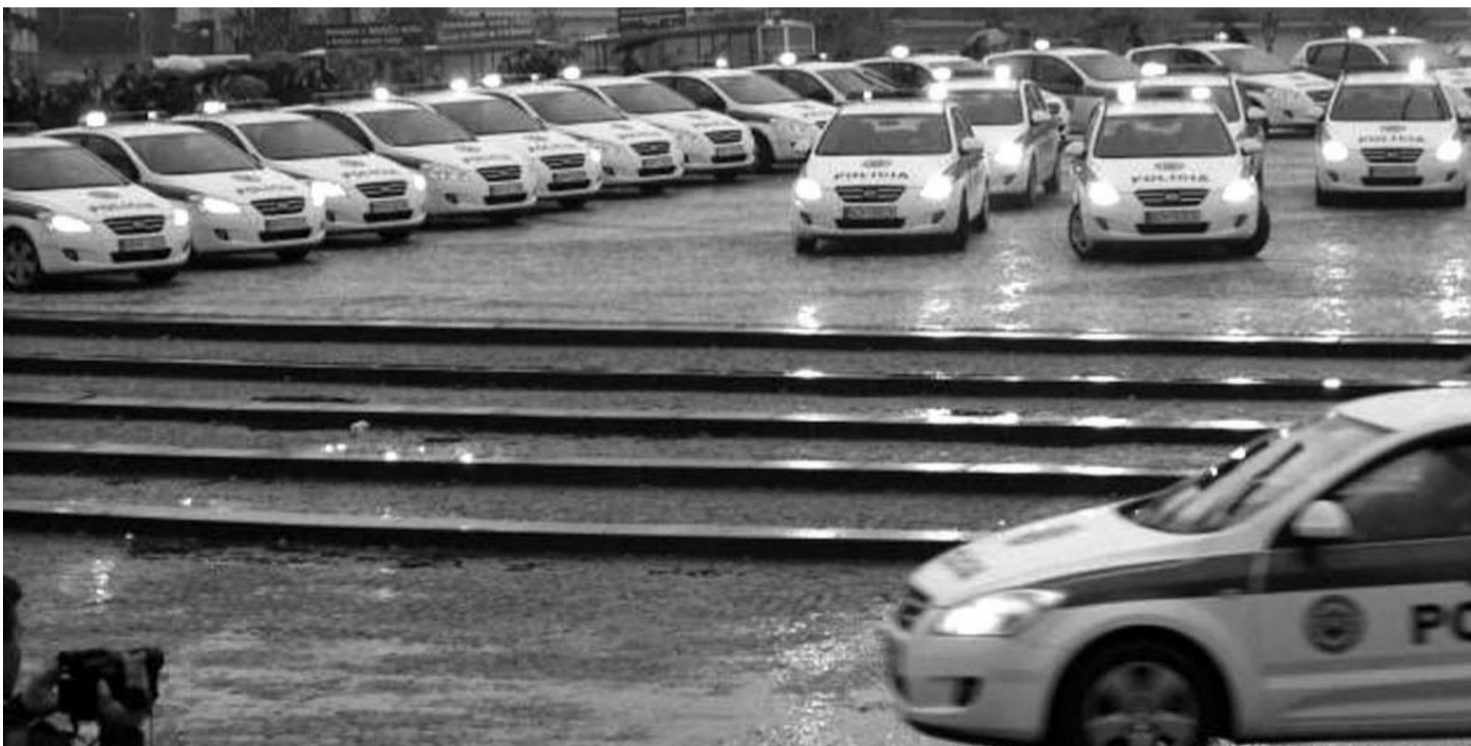
Do Nitra prišlo ďalších 45 nových áut Kia cee'd. Bližšie na strane 2