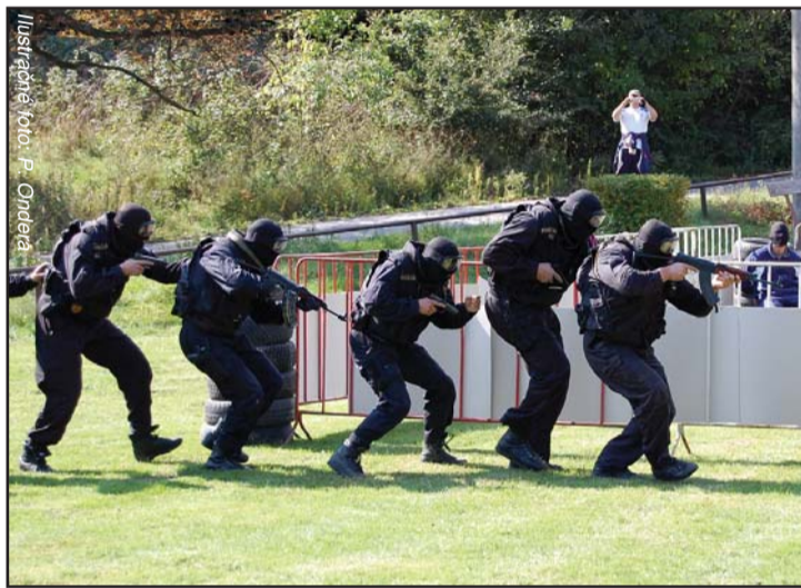
Ilustrácia: foto P. Ondrejka

organizácii bude v uliciach viac policajtov. Kým bolo v Novom Meste nad Váhom okresné riaditeľstvo, pôsobilo tu na obvodom oddelení viac než štyridsať policajtov. Teraz ich je aj s veliteľom a jeho zástupcom ani nie dvadsať. Na šesťdesiatšesť novomestský obvod, plný nedostupných lazov a kopaníc, je to naozaj málo. Ledva pokrývajú služby. Aká môže byť v takomto prípade úroveň výcviku v boji zblízka a nácvik strelby v bojovej situácii? Nechcel by som tu byť v policajtovej koži. Muž v službách zákona je na roztrhanie, na rozhodovanie nemá čas a keď tvrdšie