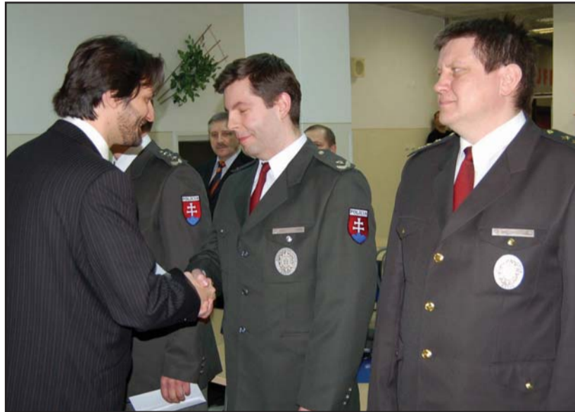
Z oceňovania Oravčanov