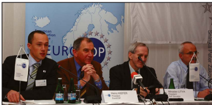
Z konferencie EuroCOP-u v Bratislave

Implementácia akéhokoľvek konceptu vnútornej bezpečnosti v Európe je spojená so zádrhelmi, ak nie je postavená na rovnako profesionálnej policajnej