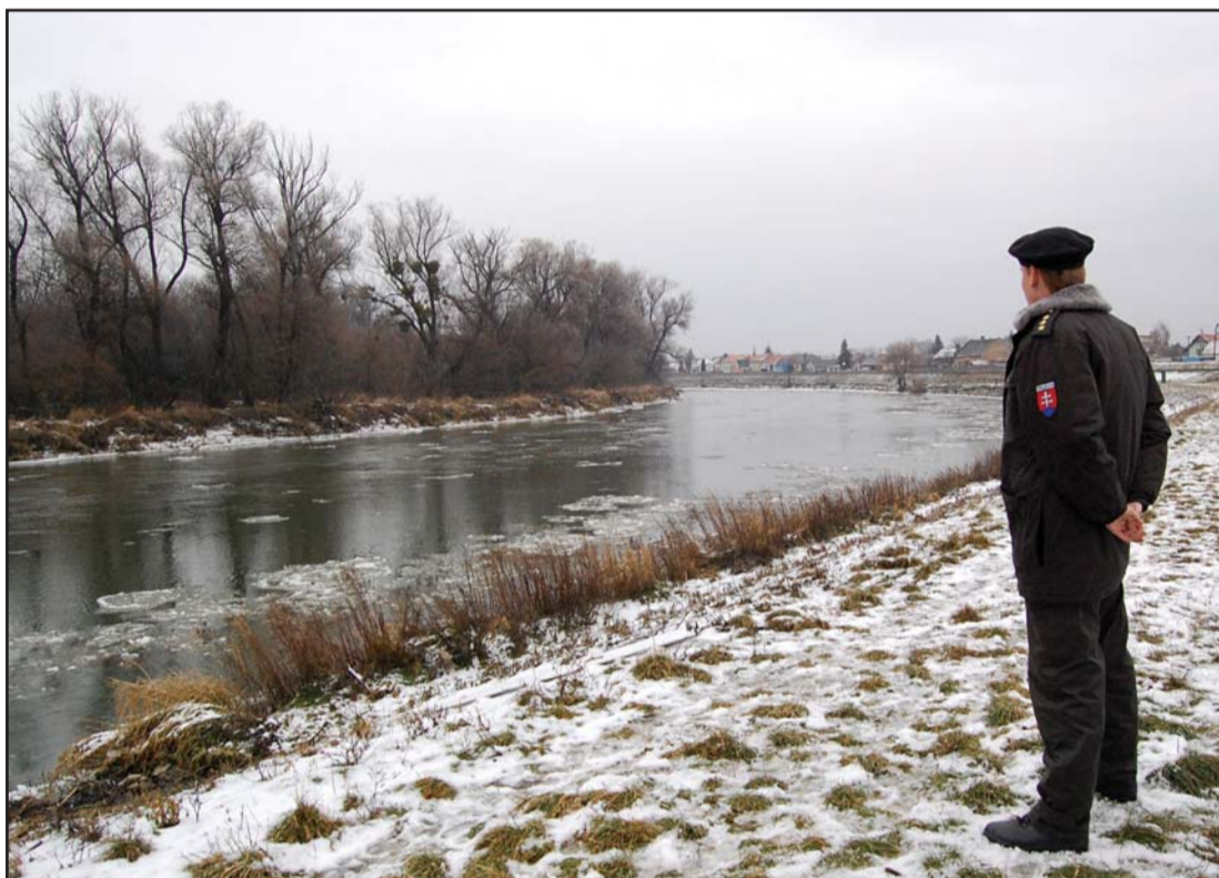
Nostalgická spomienka na štátnu hranicu v rieke Morava? Hranica ostala, ďalší osud príslušníkov hraničnej polície sa práve rieši...