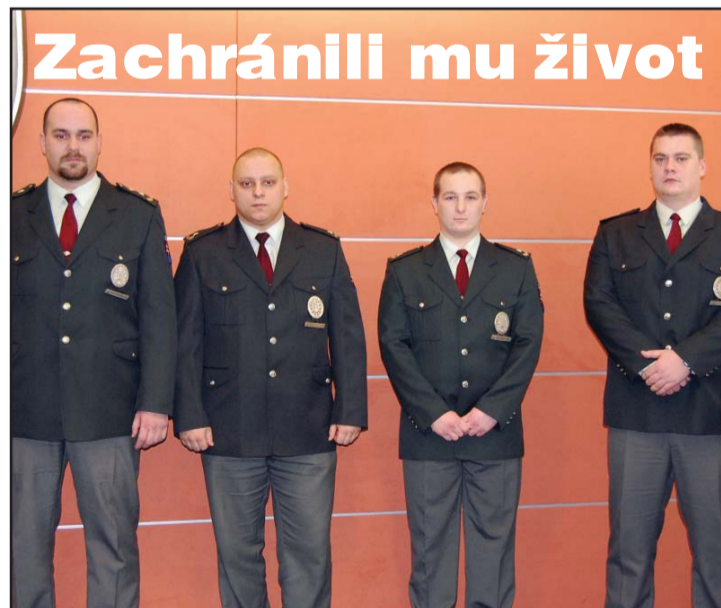
Záchrancovia z Draždiaku