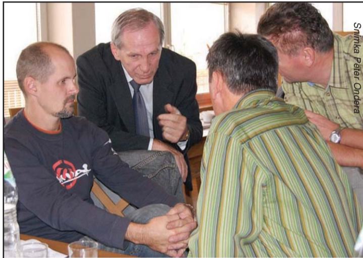
M. Litva v diskusii s predstaviteľmi základných organizácií

Vráťme sa k tomu, čo bolo meritom vstupnej otázky. Ide o kolektívnu zmluvu, teda o