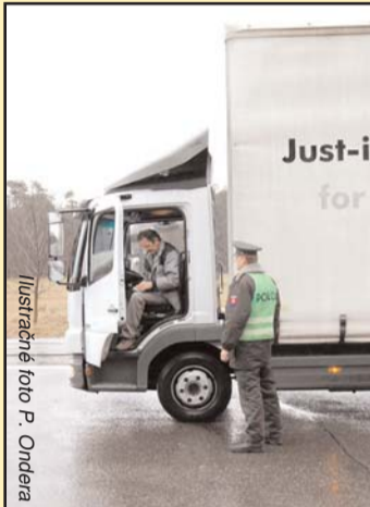
Ilustračné foto P. Ondera

peňaženke nenachádzal. Uvedenú skutočnosť ihneď oznámili na operačné stredisko so žiadosťou o lustráciu osoby, ktorej