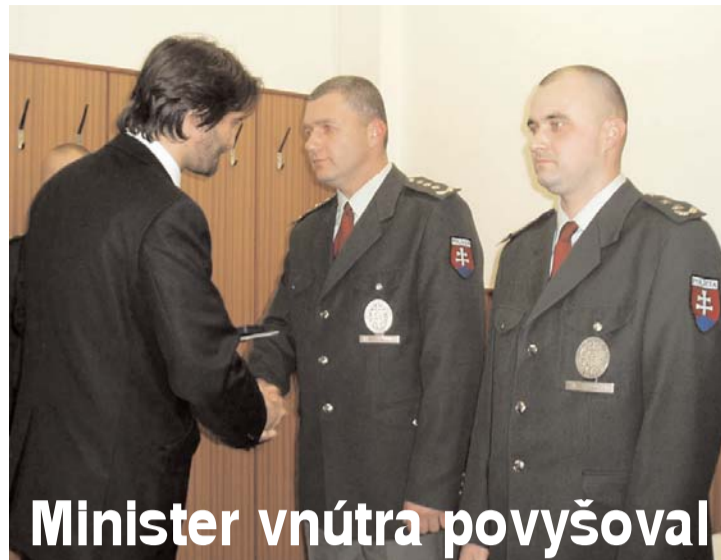
Minister vnútra povyšoval

Dlhý boj o nový systém odmeňovania a opätovný prechod príslušníkov PZ pod civilné súdnictvo sa stali realitou.