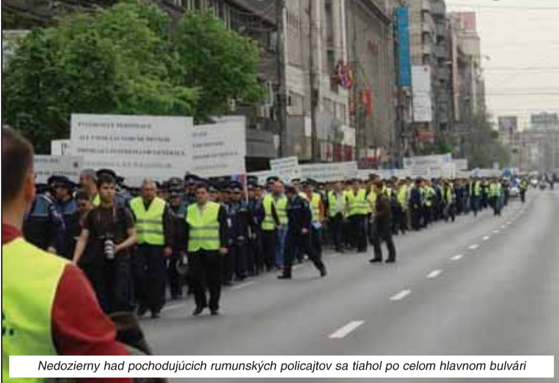
Nedozierny had pochodujúcich rumunských policajtov sa tiahol po celom hlavnom bulvári

Bukurešť, Bratislava – Metro-pola Rumunska zažila 12. apríla po prvýkrát v histórii veľký protest policajných odborárov priamo v centre mesta. Vyše štyritisíc mužov zákona v rovnošatách a v reflexných vestách vyšlo do ulíc za svoje pracovné a sociálne práva.