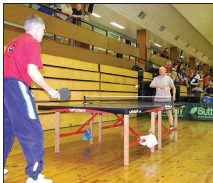
Seniori hrali s chuťou a v pohode...