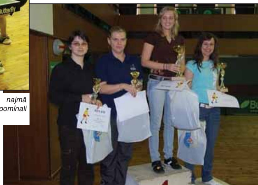
Stolnotenisový turnaj alebo súťaž krásy?