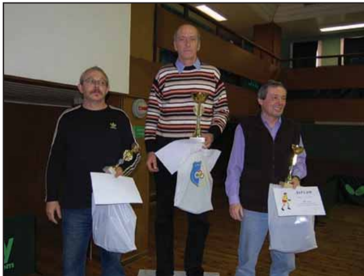
Kategória nad 50 rokov priniesla vyrovnané výkony