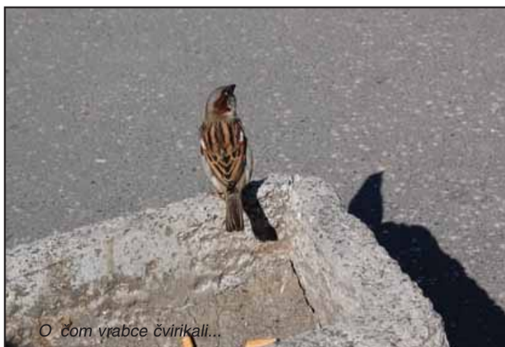
O čom vrabce čvírikali...