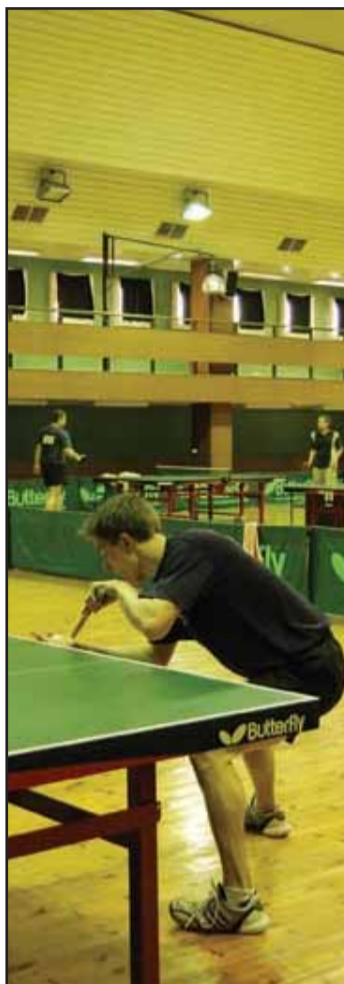
Niektoré podania najmä mladších hráčov pripomínali skôr eskamotérstvo...