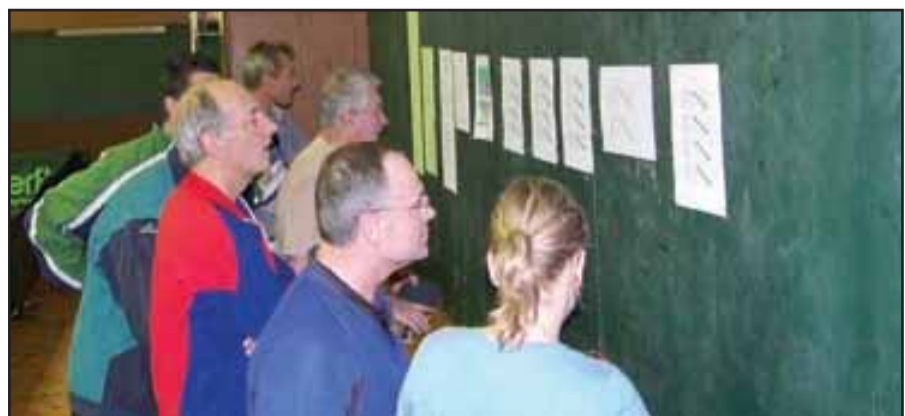
Turnajový systém je rýchly a krutý. Ak mi vylosovali nejakého favorita, rýchlo končím, myslia si hráči, študujúci rozpis zápasov