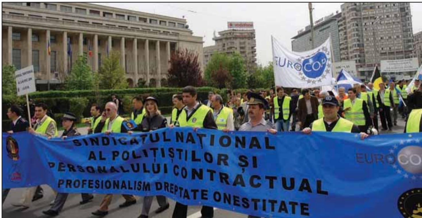
Na protestnej manifestácii rumunských kolegov v Bukurešti sa zúčastnilo viac ako štyritisíc policajtov – väčšina z nich bola v rovnosťach a vestách. Viac na strane 2.