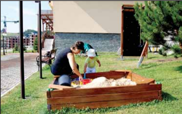
Tesne pri hoteli pribudol detský areál

Hotelovú ekonomiku kompenzujú pobyty mimo hlavných sezón, rôzne podujatia, kongresy, konferencie... Donovaly ma-