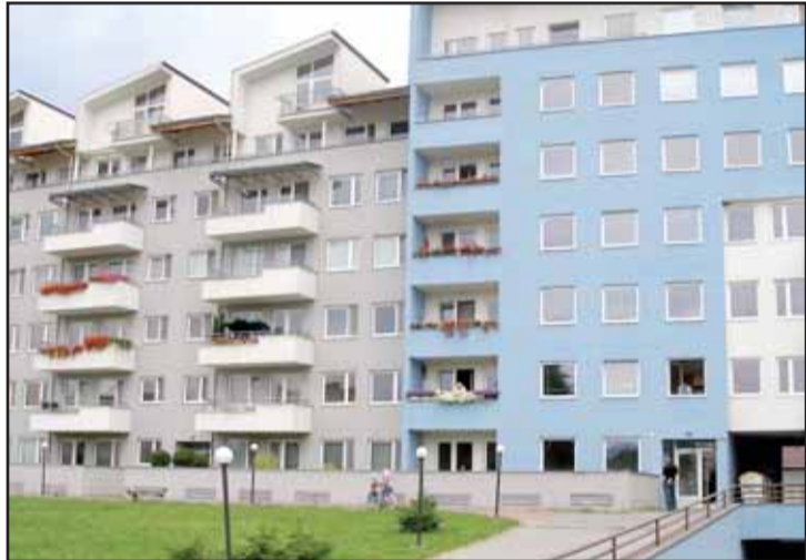
Nové bývanie pre policajtov – výborná poloha kúsok od centra, slušná architektúra

V tomto roku je to Nová Baňa a policajná stanica v Čiernom Balogu, pripravujú sa rekonštrukcie v Podbrezovej, rozbieha sa Zvolen, kde bude zrekonštruované obvodné oddelenie vrátane pracoviska pre vydáva-