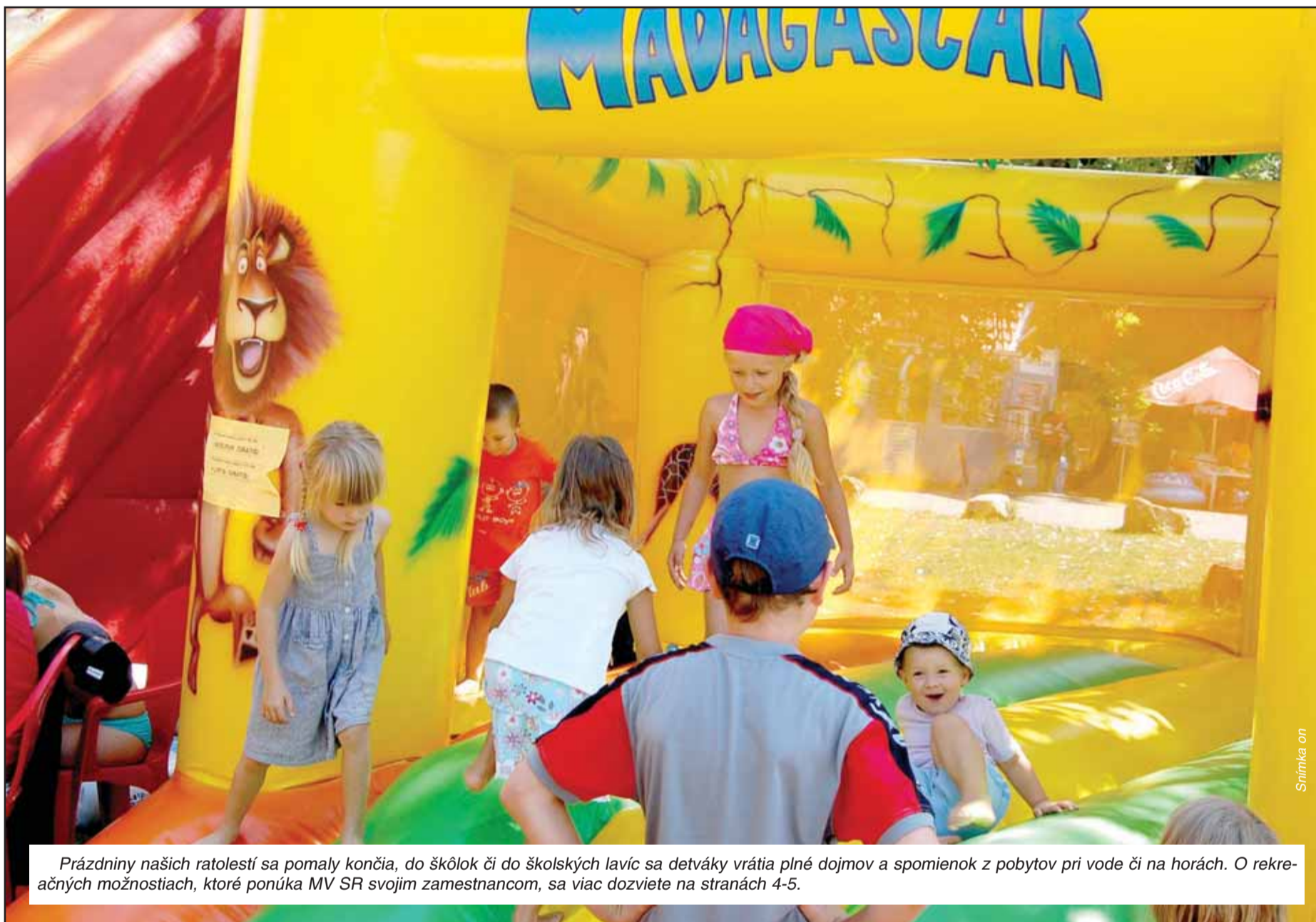
Prázdniny našich ratolestí sa pomaly končia, do škôlok či do školských lavíc sa detváky vracia plné dojmov a spomienok z pobytov pri vode či na horách. O rekreačných možnostiach, ktoré ponúka MV SR svojim zamestnancom, sa viac dozviete na stranách 4-5.