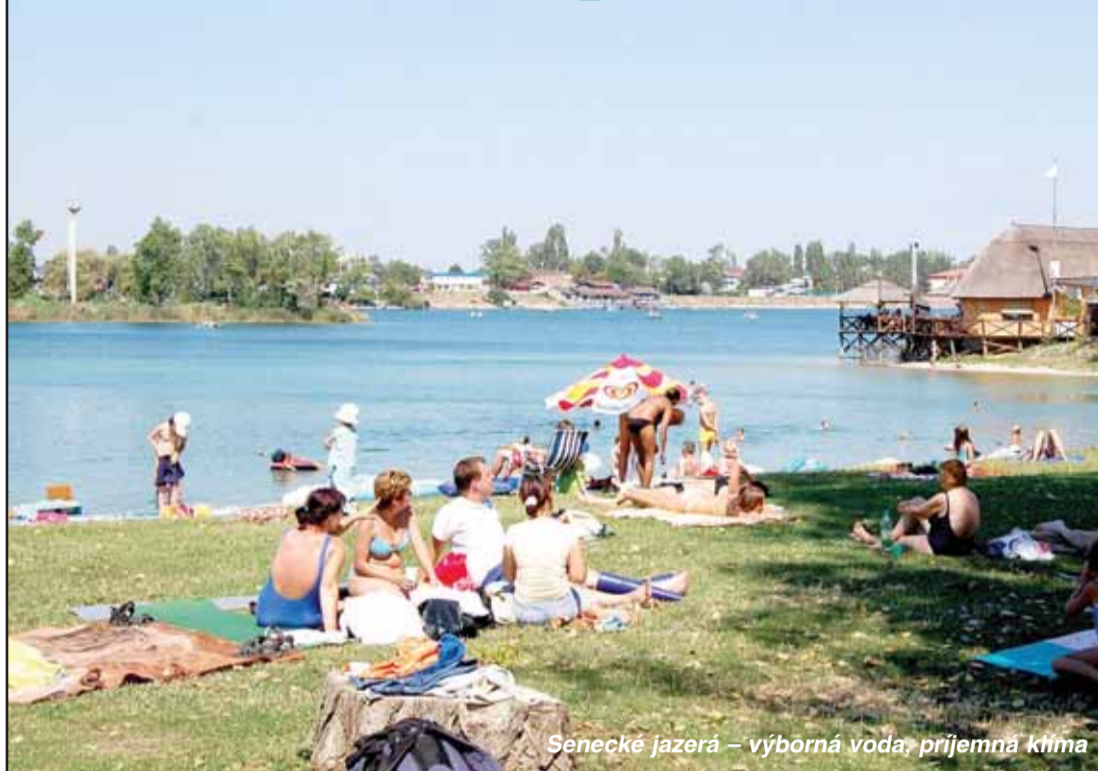
Senecké jazerá – výborná voda, príjemná klíma

Senecké jazerá: jedna z najstarších rekreačných zón na Slovensku. Pôvodne čisto chatársku zástavbu a sprivatizované rekreačné zariadenia ROH postupne zatlačá do úzadia voľný cestovný ruch so svojimi plusmi i mínusmi.