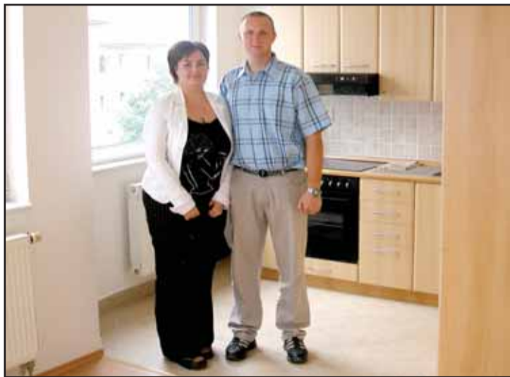
Nové nájomné byty pri OO PZ v Brezne majú kuchynské spotrebiče zabudované v linkách a nezávislé vykurovanie, noví užívatelia netajili radosť

Noví nájomníci boli nadšení, byty majú vlastné vykurovacie systémy, v linke zabudované kuchynské spotrebiče a množstvo ďalších vymožeností, o ktorých sa v niekdajších nových panelákoch nedalo ani snívať. „Sme radi, že sa to podarilo, mesto Brezno nám ešte k tomu slúbilo dva byty z vlastných kapacít, ďalšie prísľuby máme od samo-