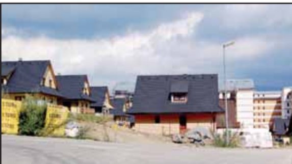
Učupené drevenice a v tesnej blízkosti hotelisko: ani architektúra, ani urbanizmus, ani územné plánovanie!

to už stabilizovaný kolektív, ktorý sa roky prakticky nemení. „Čistota, kvalita stravy, doplnkové služby,“ vymenúva riaditeľ kritériá, ktoré pre dokonalý servis považuje za najdôležitejšie. Preto zariadenie ponúka – na naše rezortné pomery – neobvykle veľký sortiment doplnkových služieb, možnosť zápožičiek bicyklov, korčulí a ostatných zariadení na aktívne