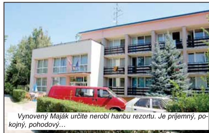
Vynovený Maják určite nerobí hanbu rezortu. Je príjemný, pohodlný, pohodový...

Ozaj, aká je to logika? Rentabilita je aj vďaka tomu veľmi relatívna. Hlavný problém – objekt nie je napojený na plyn, hoci len asi 500 metrov ďalej mal obrovské rekreačné zariadenie Slovenský plynárenský priemysel. Vraj na prípojku až k Majáku ne-