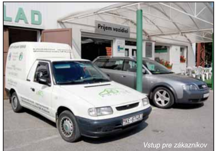
Vstup pre zákazníkov

mom je však skutočnosť, že organizácia samotného úkonu zo strany objednávateľa je neefektívne režírovaná na dvoch pracoviskách. Ráno sa vodič najprv musí zastaviť na kraji, zabezpečiť si vypísanie žiadanky na výmenu oleja, pretože to si kraj robí sám vo svojej technickej opravovni. Tam čaká, kým mu to urobia, až následne ide požiadať o druhú objednávku do servisu, nechá si ju potvrdiť a kým príde k nám, je často desať hodín a viac. A potom je vodič nervózný, že opäť musí čakať. Ale keby sa ohlásili vopred, môžeme sa pripraviť – objednať náhradné dielce atď. Tým by sa skrátila doba pobytu vozidla v opravovni a efektom by bola aj zvýšená vzájomná spokojnosť... to málokto z vodičov vie,“ šomre.