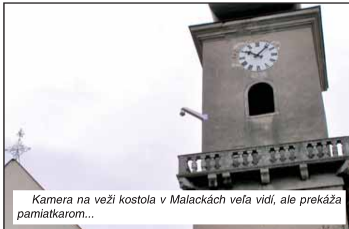
Kamera na veži kostola v Malackách veľa vidí, ale prekáža pamiatkarom...

hybovala medzi 61 a 97 percentami. Zaujímavé ale bolo, že informácie o tom, že v danej oblasti boli inštalované kamery, nevedlo automaticky respondentov nevyhnutne k posilneniu pocitu bezpečnosti (hoci sa mierne zvýšil). Z hľadiska zmien správania sa bolo konštatované, že iba 1 percento respondentov uviedlo, že sa vyhýbajú miestam, kde bol KMS inštalovaný, teda nie je rušivým elementom. Miera podpory KMS zostala pomerne vysoká (viac ako 70 percent) a aj obavy z dopadov na občianske slobody sa po zavedení KMS mierne znížili (pred zavedením 17 percent, po inštalácii o 2 – 7 percent menej).