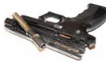
▲ K100 s nástrelom 112 000 výstrelov