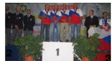
▲ EHC 2007 Cheval Blanc, Francúzko

Viac technických informácií môžete nájsť na našej webovej stránke www.grandpower.eu kde môžete tiež vidieť možné vybavenie modelov nami vyrábanými doplnkami. Naším cieľom je ponúknuť spoľahlivú služobnú zbraň s pružným servisom za výhodnú cenu.