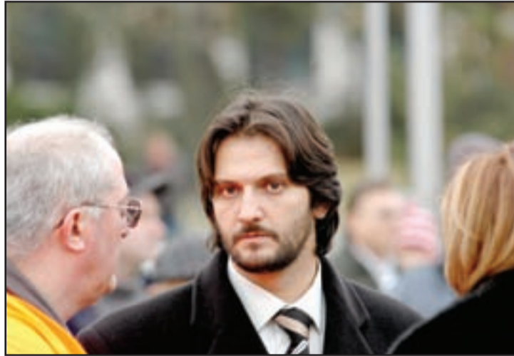
Robert Kaliňák sa ako prvý opozičný predseda nášho gesčného parlamentného výboru „v tichosti“ zúčastnil aj protestu 3. decembra 2005

Toto sú veci, ktoré nás čakajú aj do budúcnosti. Neviem, či sa ich dožijem, ale želám všetkým, ktorí prídu po mne, aby sa im to podarilo zabezpečiť. Na záver sa chcem naozaj poďakovať za príkladnú spoluprácu s odborármi a naozaj ma prekvapila predovšetkým v tom, že nešlo o predkladanie nárokov zo strany odborov, a len žiadostí, ale nestalo sa raz, že by odborári prišli do mojej kancelárie a nedoniesli by zároveň aj riešenia, s ktorými sa dalo súhlasiť. Samozrejme, pán predseda odborov si bude pamätať, mali sme aj veľké hádky, mali sme aj veľa sporov, ale vždy z nich nakoniec vzišlo riešenie, ktoré bolo pre policajtov tým najlepším riešením. Chcem sa vám, všetkým odborárom, veľmi pekne poďakovať za tieto tri roky, boli pre mňa mimoriadne poučné a verím, že sme spoločne urobili niečo, na čo sa budeme možno o ďalšie dva tri zjazdy pozeráť na plátne už možno trochu starší a s úsmevom si spomenieme, že to boli naše dobré roky.