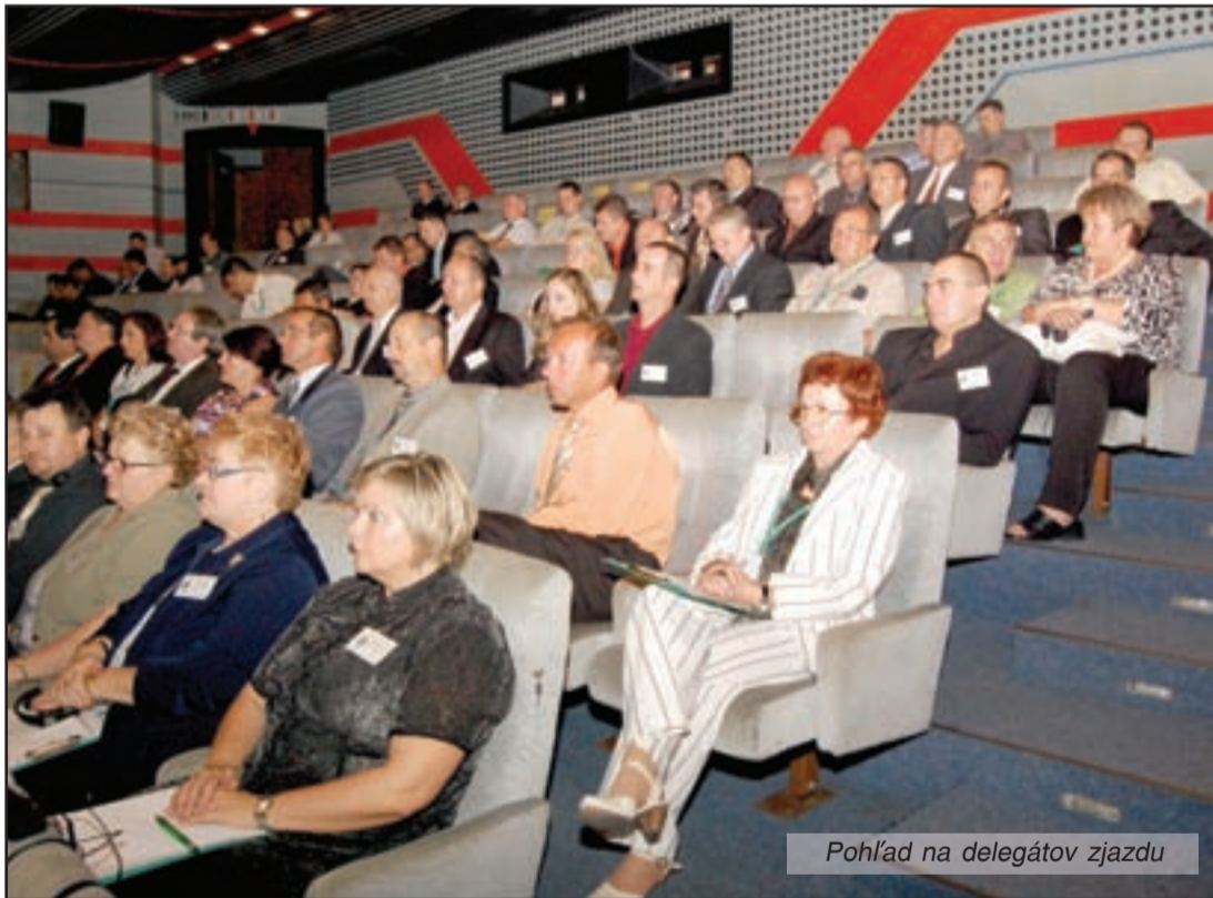
Pohľad na delegátov zjazdu