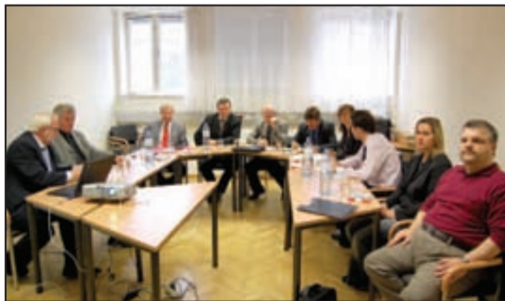
Záber zo stretnutia predákov policajných odborov Slovenska a Rakúska vo Viedni.

mesiacov, ale mladým policajtom veľmi chýba prax, preto zriaďujeme tzv. stálu poriadkovú jednotku, ktorá im doplní praktické skúsenosti. Navyše naše základné štúdium je orientované výlučne na obsadenie najzákladnejších funkcií v I. a II. platovej triede, ostatné funkcie sú pokryté ďalším vzdelávaním.