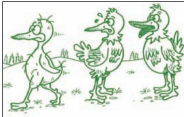
„Po chorobe?“ „Nie, po rozvode...“

V živote som pracoval iba raz ako čašník v diskoclube Steps, aj to len tri hodiny. Po psy-