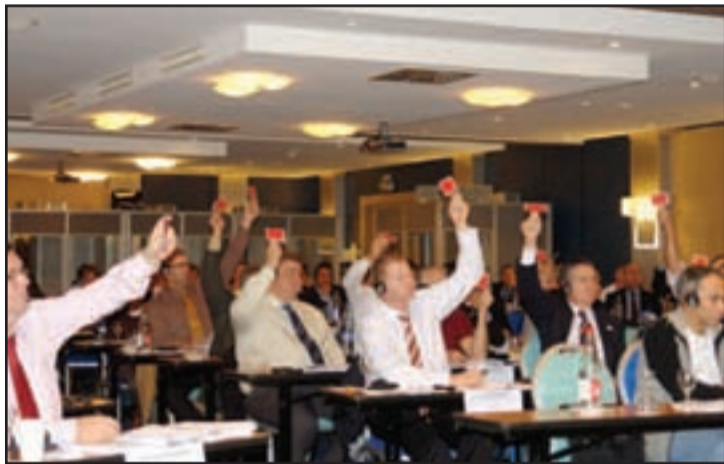
Z hlasovania na jesennom zasadaní Euro-COP-u

Slovenskej republiky, sme v tomto smere ďaleko vpredu.