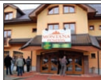
Zimné rokovanie rady predsedov sa konalo v penzióne Montana v Terchovej