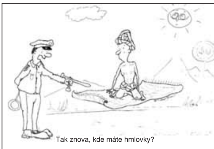
Tak znova, kde máte hmlovky?