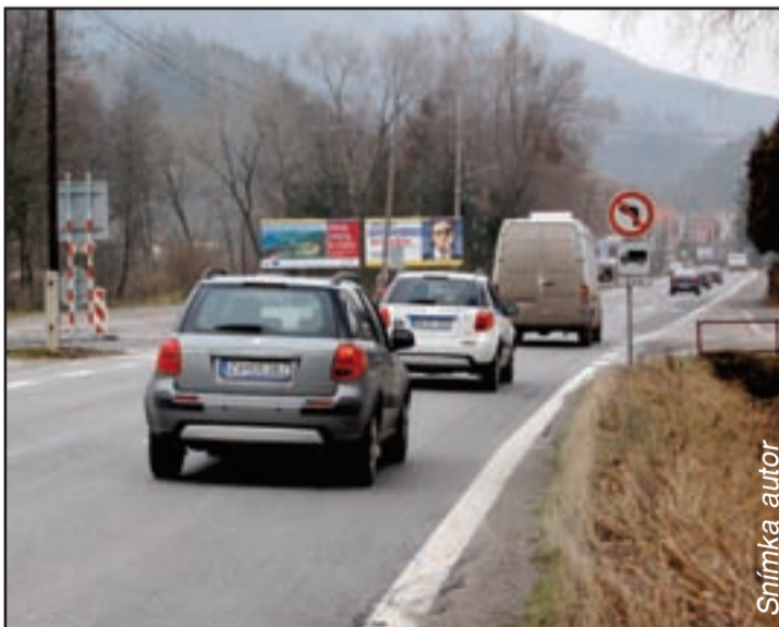
Liptovskou Osadou vedie veľmi frekventovaná cesta cez Donovaly

tu nie sú na to, aby ich volali len vtedy, keď treba niekoho prepustiť alebo mu zobrať príplatok. Názor odborov bude pre mňa zaujímavý, do svojich poradných orgánov dám delegovať zástupcov OZP, budú všade