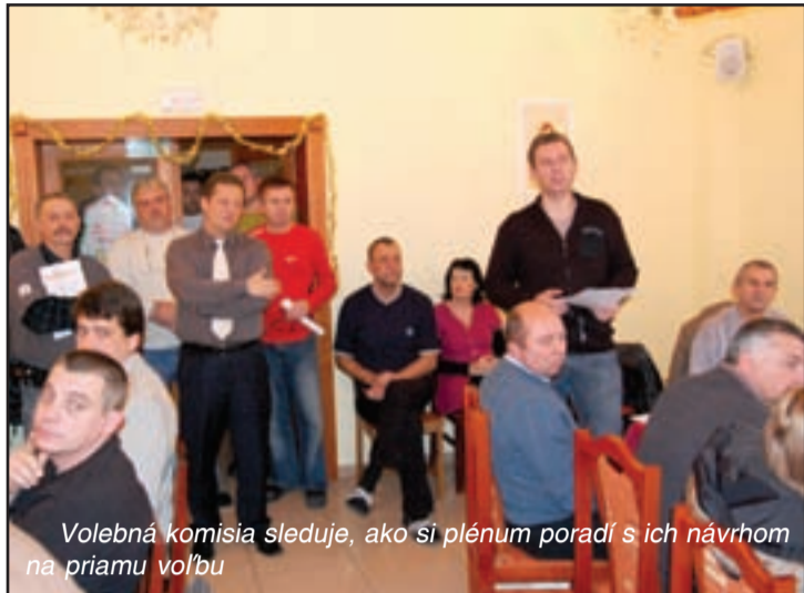
Volebná komisia sleduje, ako si plénum poradí s ich návrhom na priamu voľbu