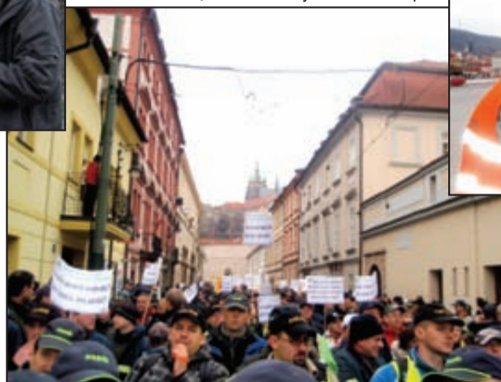
Hluk v uličke prakticky znemožnil rokovanie parlamentu