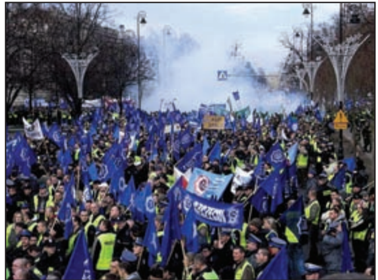
Vo Varšave vyšlo do ulíc päťtisíc protestujúcich policajtov

Ďalší protest štátnych zamestnancov slovenskú delegáciu OZP v SR zaviedol 9. decembra do stavežatej Prahy. Český parlament mal v ten deň rozhodnúť o výške štátneho rozpočtu pre rok 2010, ktorý navrhol zníženie plátov štátnych zamestnancov o 4 percentá, ozbrojeným zložkám až o 5,5 percenta. Na proteste dominovali hasiči, väzenskí dozorcovia a policajti. Názory o počte protestujúcich sa veľmi rôznili, úzke uličky pred českým parlamentom však zaplnilo minimálne dvetisíc ľudí, niektoré zdroje ho-