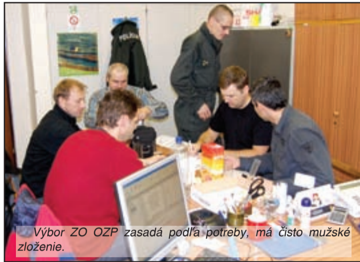
Výbor ZO OZP zasadá podľa potreby, má čisto mužské zloženie.

vorí, že dôstojná úroveň ich pracoviska má pozitívny vplyv nielen na zamestnancov, na ich vystupovanie, ale predovšetkým na stránky, keďže väčšina prichádzajúcich sú poškodení a svedkovia, nie páchatelia. „Také-