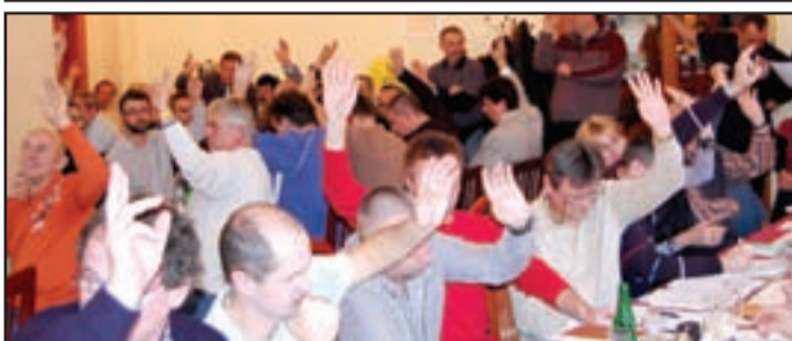
Verejné jednotlivé hlasovanie o novom predsedovi a podpredsedoch bolo jednoznačné