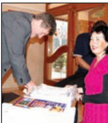
Nech sa páči, nové kalendáre na rok 2010!