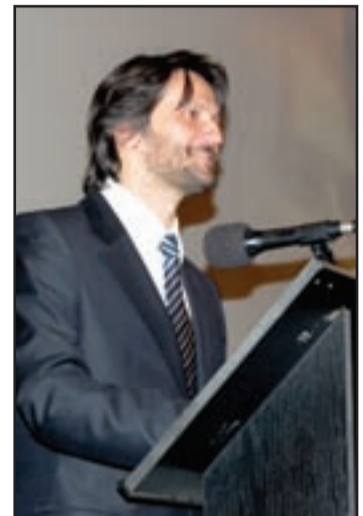
Slávnostné zasadanie sa nieslo v priateľskej, srdečnej atmosfére