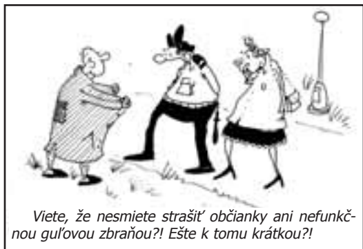
Viete, že nesmieme strašiť občianky ani nefunkčnou guľovou zbraňou?! Ešte k tomu krátkou?!