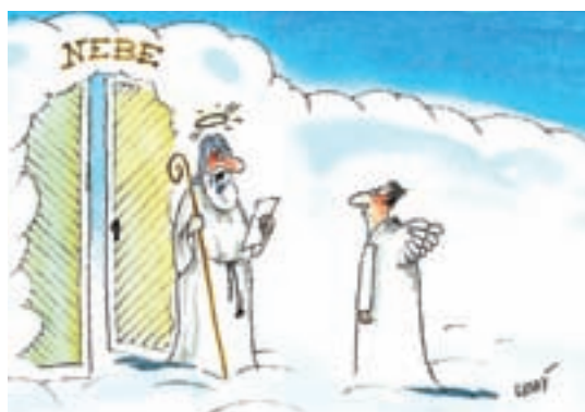
Celý život samé dobré skutky? Tak to musíte ísť vchodom pre blbcov!