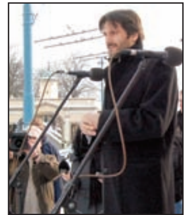
Príchod Roberta Kaliňáka bol celkom neočakávaný, minister netajil dojatie

SR Roberta Kaliňáka napokon poslanci neodvolali, za jeho odchod hlasovalo len 44 poslancov, proti bolo 53, dovedna sa