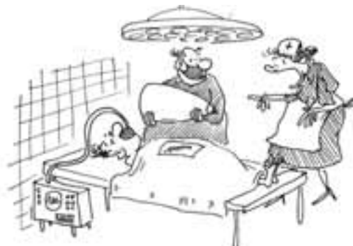
Pán doktor, vy ste borec! Hneď na prvýkrát ste našli guľku v tele!