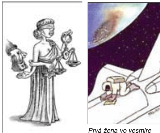
Prvá žena vo vesmíre