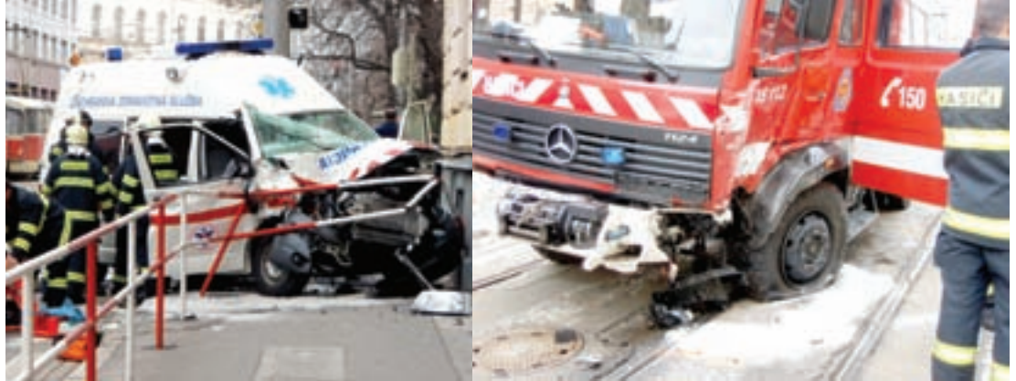
Na križovatke v tesnej blízkosti budovy KR PZ Bratislava sa zrazili dve záchranárske vozidlá, pohľadájúce sa na zásah so zapnutými majákmi. Žiaľ, havária sa nezaobišla bez zranení...