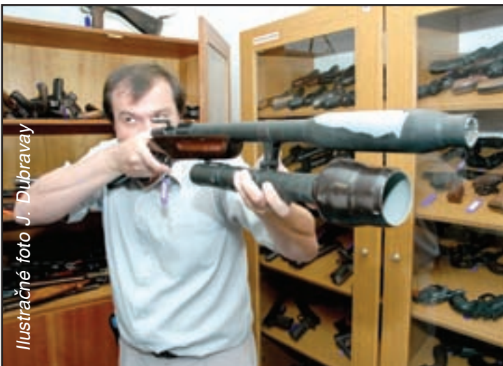
Ilustračné

Inzeráty typu „Predám zbraň“ by už Slováci na internet dávať nemali. Zabráni im v tom vládna novela zákona o zbraniach a strelive, ktorú dnes schválil parlament. Právna norma dopĺňa doteraz chýbajúci kategorický zákaz uzatvárať zmluvu na diaľku, ktorej predmetom je kúpa zbrane alebo streliva. „Dochádza k tomu, aby zbraň bolo možné nakupovať len v kamenných obchodoch, pretože pôvod zbrane, jej označenie a všetky veci súvisiace s nakupovaním zbraní je potrebné overiť na mieste. Procedúra nákupu zbraní je komplikovaná,“ vysvetlil predkladateľ novely minister vnútra Robert Kaliňák a dodal, že „rozvoj nakupovania zbraní cez internet rozhodne nie je vhodné podporovať.“ Minister si predaj zbraní cez internet ani nevie predstaviť.