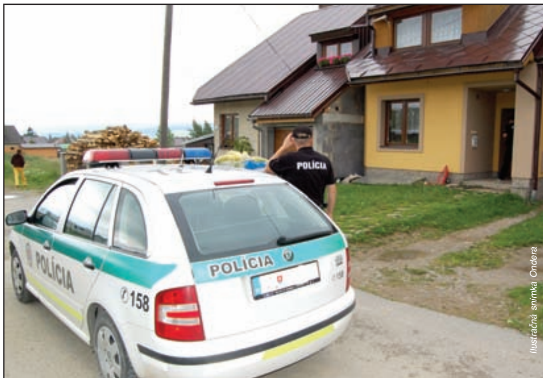
Ilustračná