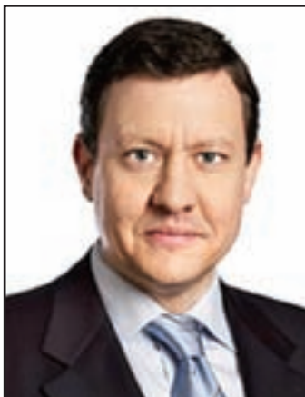
JUDr. Daniel Lipšic