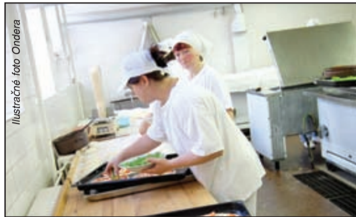
Ilustračné foto Ondera

povede a novučkú, za štátne prostriedky konečne perfektne vybavenú kuchyňu dá ministerstvo do prenájmu súkromnej firme.