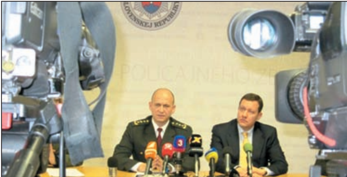
Tlačová beseda vedenia rezortu k odštartovaniu systému hodnotiacich kritérií (13. januára 2011) sa tešila neobyčajnému záujmu médií.

Príspevky, publikované v rubrike NÁZOR, nemusia korešpondovať s pohľadom vydavateľa mesačníka POLÍCIA.