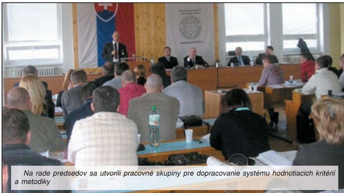
Na rade predsedov sa utvorili pracovné skupiny pre dopracovanie systému hodnotiacich kritérií a metodiky