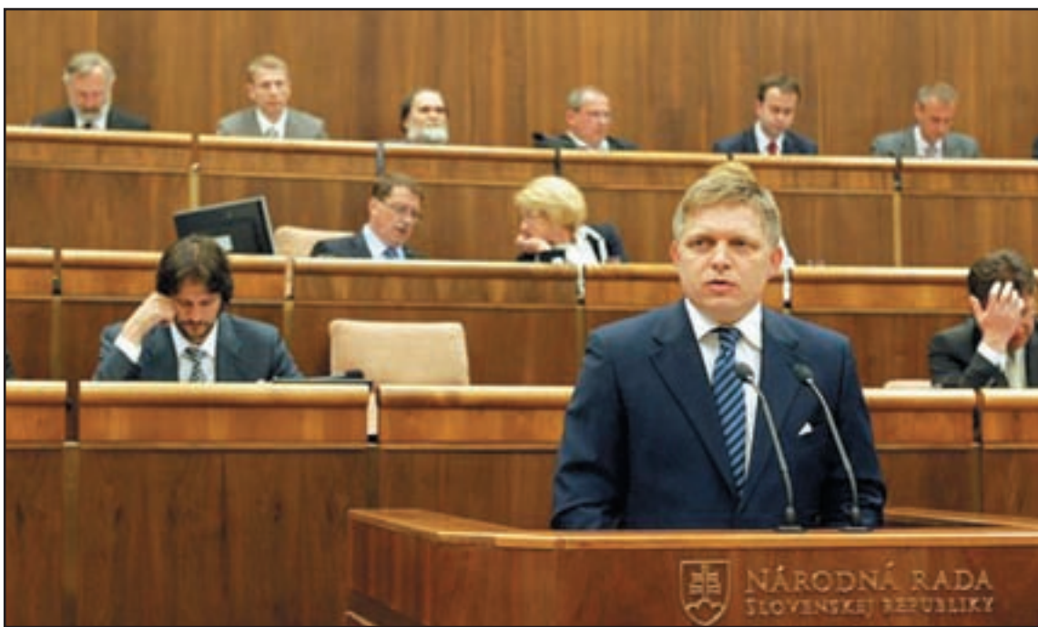
Predseda vlády SR Robert Fico predstavil programové vyhlásenie vlády SR pre roky 2012 až 2016 poslancom Národnej rady SR

kompromisne bojovať proti akýmkoľvek prejavom extrémizmu, rasizmu, neznášanlivosti, xenofóbie, antisemitizmu a agresívneho nacionalizmu. Zameria sa najmä na systematické vzdelávanie príslušných profesijných skupín, ktoré majú pri výkone svojho povolania vplyv na predchádzanie extrémizmu a rasovo motivovanej trestnej činnosti, zvyšovanie právneho vedomia a informovanie verejnosti a implementáciu záväzkov vyplývajúcich z medzinárodných dohôd v oblasti boja proti extrémizmu a rasovo motivovanej trestnej činnosti. Vláda zvýší úsilie v boji s nebezpeč-