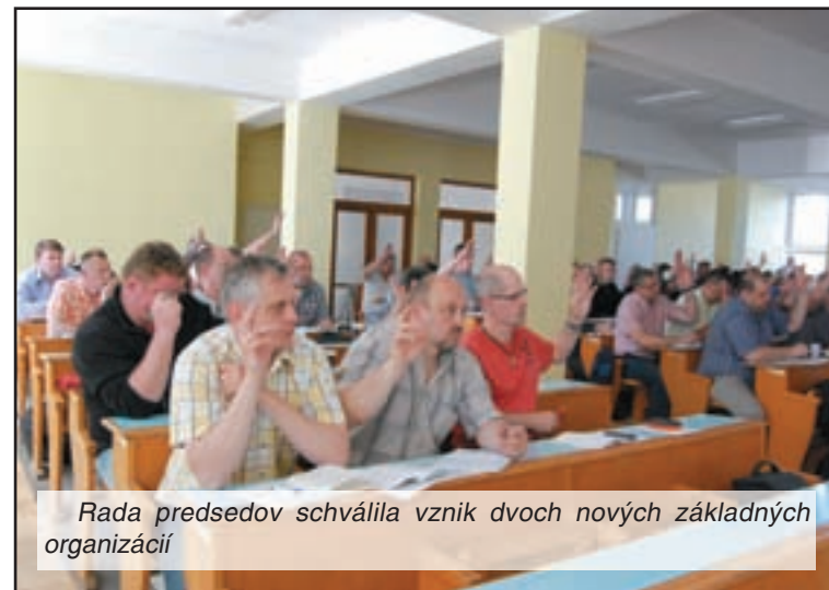
Rada predsedov schválila vznik dvoch nových základných organizácií

buldol pocit, že predsedovia si zobrali za svoje dôležitú úlohu aktivizovať ľudí a primaf ich k tomu, aby dve percentá venovali OZP. Vefa ľudí zrejme ešte túto