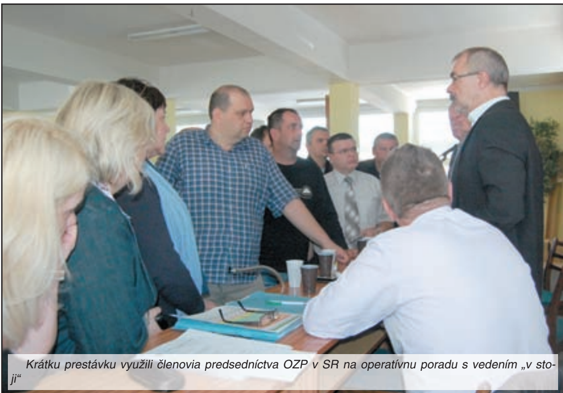
Krátku prestávku využili členovia predsedníctva OZP v SR na operatívnu poradu s vedením „v stolí“

vnútra Robert Kaliňák, v piatok však neplánovane zasadala vláda SR a minister sa ospravedlnil.