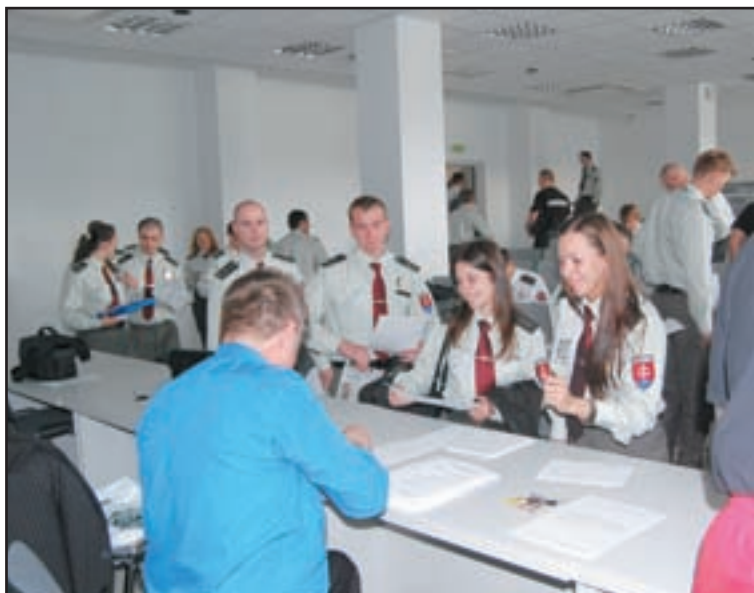
Záujem o členstvo v OZP prejavila polovica zo zúčastnených študentov