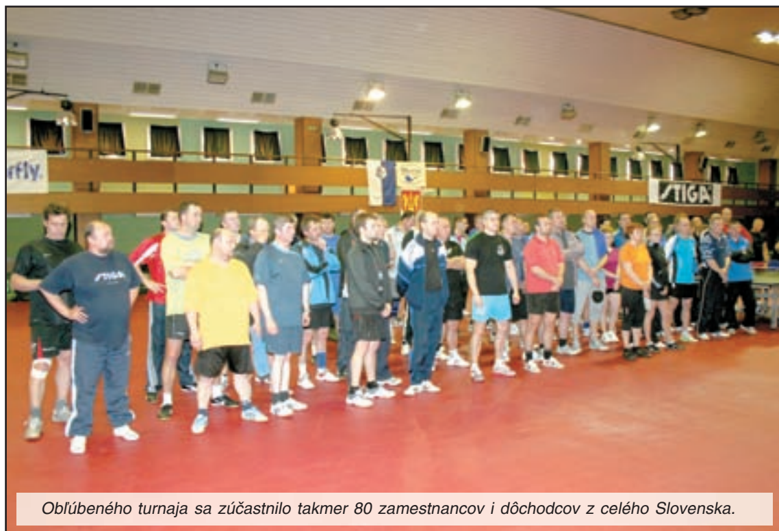
Oblúbeného turnaja sa zúčastnilo takmer 80 zamestnancov i dôchodcov z celého Slovenska.

chutným gulášom a párkami. Každý účastník turnaja dostal na pamiatku tričko s logom turnaja a prví štyria hráči v každej kategórii poháre, diplomy a vecné ceny, ktoré pre nich zabezpečili organizátori.