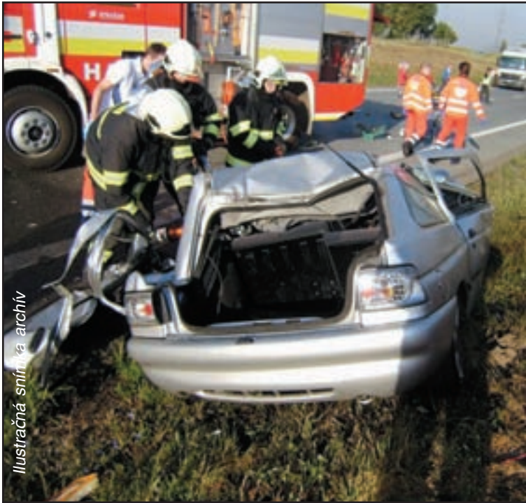
Ilustračná snímka z archívu