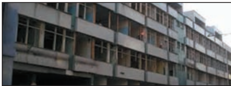
Dostavba je zatiaľ otvorená otázka...

Nemocnica sv. Michala je akciová spoločnosť so 100 per-