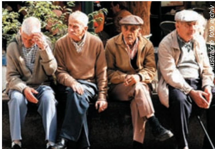
Ilustračné foto archív

Nuž, nitriansky aktív bol tak akosi „výsluhovo vojenský“. Aj ďalší diskutujúci boli totiž prevažne z radov bývalých vojakov, teda výsluhoví dôchodcovia. Té-