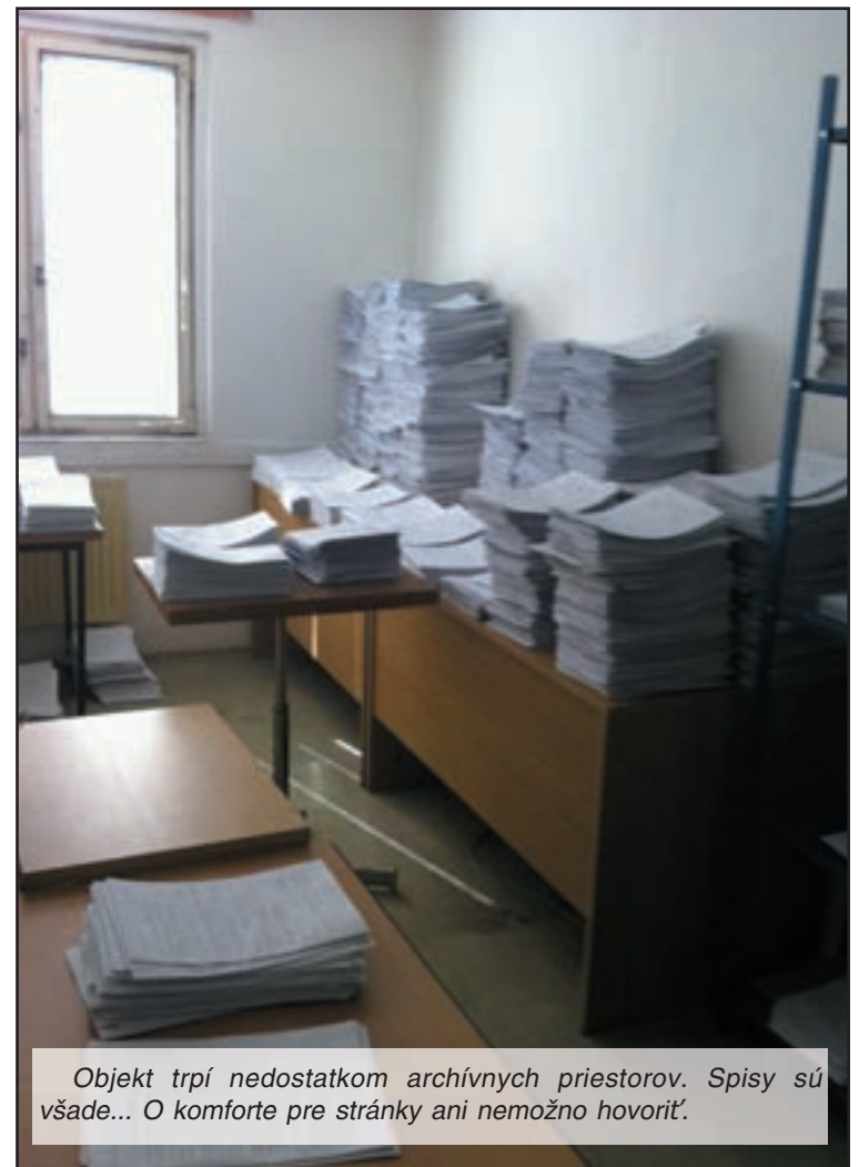
Objekt trpí nedostatkom archívnych priestorov. Spisy sú všade... O komforte pre stránky ani nemožno hovoriť.

10. Parkovacia plocha pre kontrolovanie motorových vozidiel je nerovná. Sú tam výmlyty, ktoré sťažujú vykonanie požadovanej