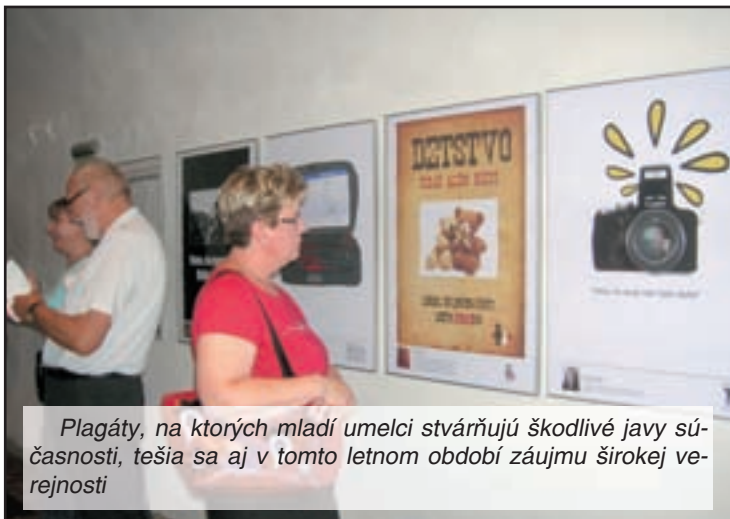
Plagáty, na ktorých mladí umelci stvárňujú škodlivé javy súčasnosti, tešia sa aj v tomto letnom období záujmu širokej verejnosti

za zdravý vývoj svojho dieťaťa – a to aj v súvislostiach, ktoré vo svojich prácach stvárňujú 17 a