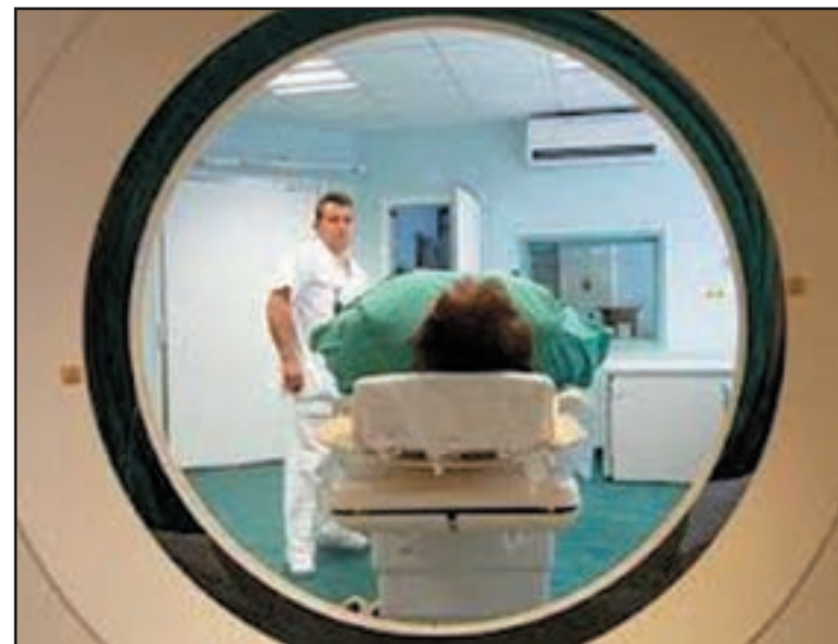
V oblasti prístrojového vybavenia má Nemocnica sv. Michala vysoké ambície

vznikla koncom roka 2008 spojením nemocníc rezortu obrany a rezortu vnútra, 411 zamestnancov v pracovnom pomere a 49 zamestnancov v obdobnom pracovnom pomere s priemernou