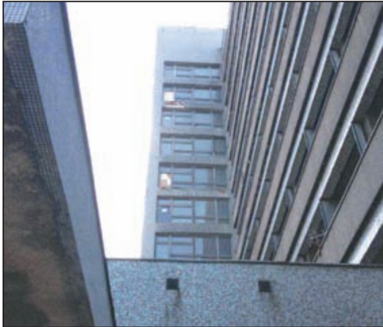
Moloch ubytovne na Saratovskej sa pomaly rozpadáva. (vľavo). Vidieť to zvonka, ešte viac zvnútra. Kiežby policajti mohli čo najskôr vojsť do zrekonštruovaných priestorov, ako v prípade vynoveného bloku v SOŠ PZ Pezínok začiatkom tohto roka...