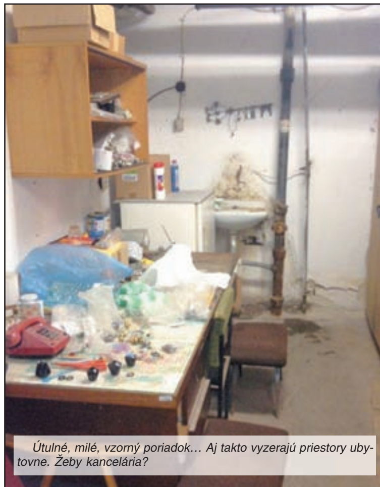
Útulné, milé, vzhľadom... Aj takto vyzerajú priestory ubytovne. Žeby kancelária?

na opravy a údržbu vynaložené cez 30 tis. eur, k dnešnému dňu bolo za rok 2012 uhradená suma 21.225,86 eur.