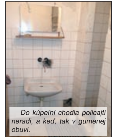
Do kúpeľní chodia policajti neradi, a keď, tak v gumenej obuvi.

majetku. Na základe tohto boli správcovi objektu požiadaní aj upratovačky o nahlasovanie zistených závad.