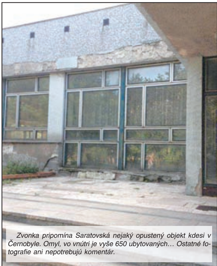
Zvonka pripomína Saratovská nejaký opustený objekt kdesi v Černobyle. Omyl, vo vnútri je vyše 650 ubytovaných... Ostatné fotografie ani nepotrebujú komentár.

zamestnancov MV SR. Avšak píše sa rok 2012 a ubytovňa Saratov ostáva nezmenená, bez väčších vonkajších a vnútorných úprav. A tak, ako starne človek,