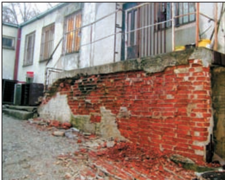
Celý objekt je absolútne mokrý – zospodu vzlínavosťou, cez strechy tečie...