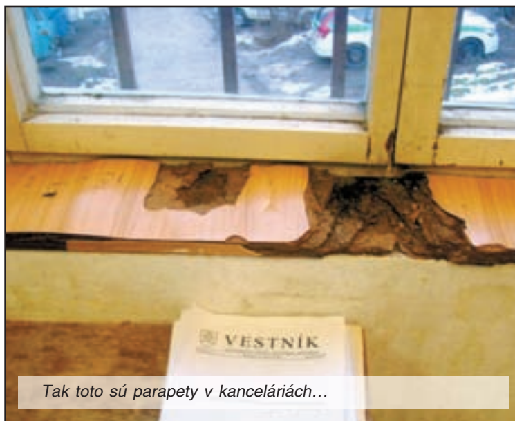
Tak toto sú parapety v kanceláriách...