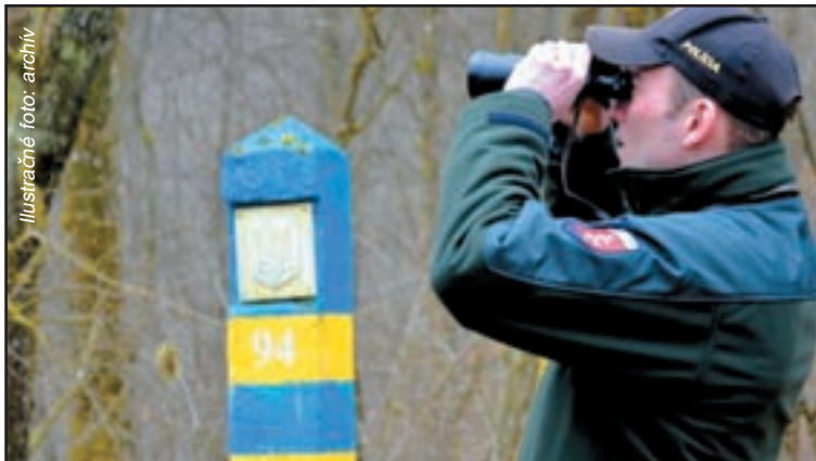
Ilustračné foto: archiv

Schengenské hodnotenie, ktoré sa robí po piatich rokoch od nášho vstupu do tohto priestoru, sa tento rok bude týkať víz, ale aj pozemnej hranice s Ukrajinou. Tento mesiac sa na slovenskom zastupiteľskom úrade v Moskve a Generálnom konzuláte SR v Užhorode bude hodnotiť správne uplatňovanie schengenských pravidiel v oblasti víz a konzulárnej spolupráce. V júli čaká Slovensko kontrola vonkajšej pozemnej hranice. Na jeseň budú zase hodnotiť Schengenský informačný sys-