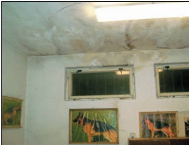
Dažďová voda cez deravú krytinu ohrozuje elektrické rozvody