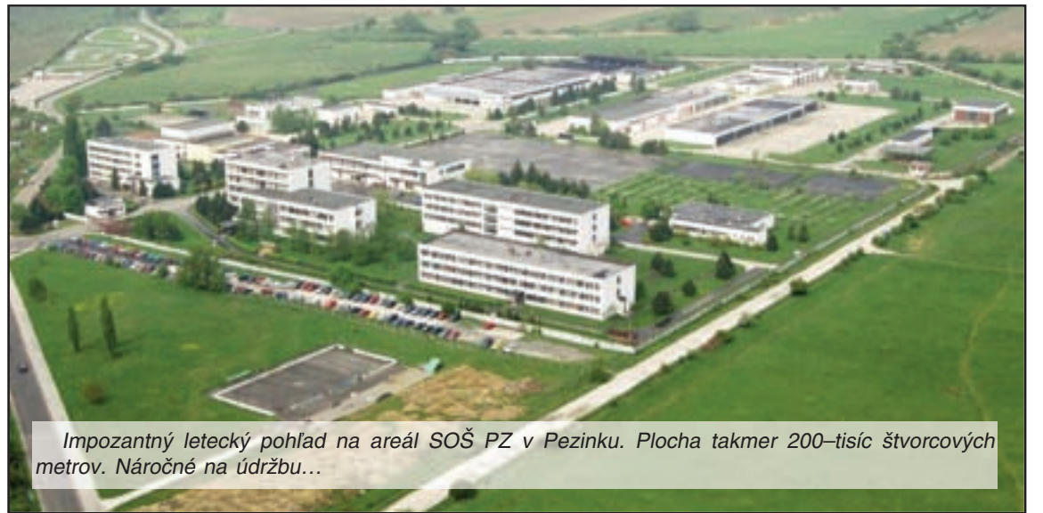
Impozantný letecký pohľad na areál SOŠ PZ v Pezinku. Plocha takmer 200-tisíc štvorcových metrov. Náročná na údržbu...