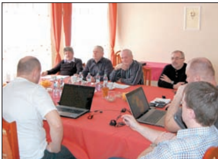
Reprezentácie českého a slovenského policajného odborového zväzu dohodli o spoločnom postupe na rokovaní EuroCOP-u

álnou situáciou v našich zväzoch, prebrali sme problematiku možného spoločného postupu pri rokovaní v EuroCOP-e, zaoberali sme sa porovnávaním pracovných podmienok v českej a slovenskej polícii, formami zvyšovania členskej základne v národných zväzoch a hovorili sme aj o priamej medzinárodnej spolupráci našich základných organizácií.