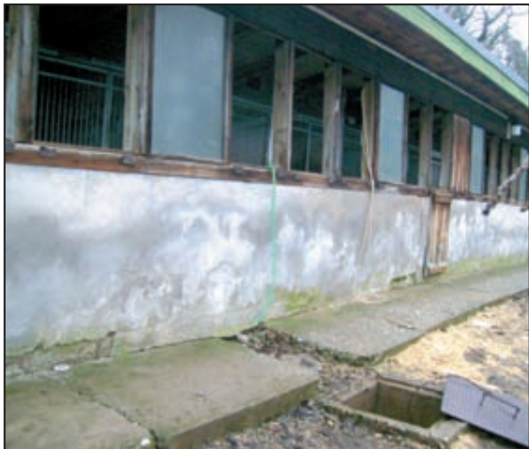
Úplne podmočené a plesnivé sú aj koterce pre služobných psov