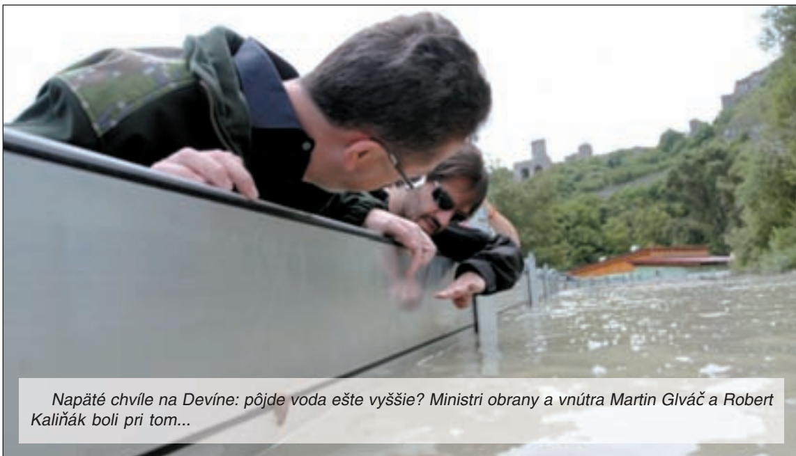
Napäté chvíle na Devíne: pôjde voda ešte vyššie? Ministri obrany a vnútra Martin Giváč a Robert Kaliňák boli pri tom...