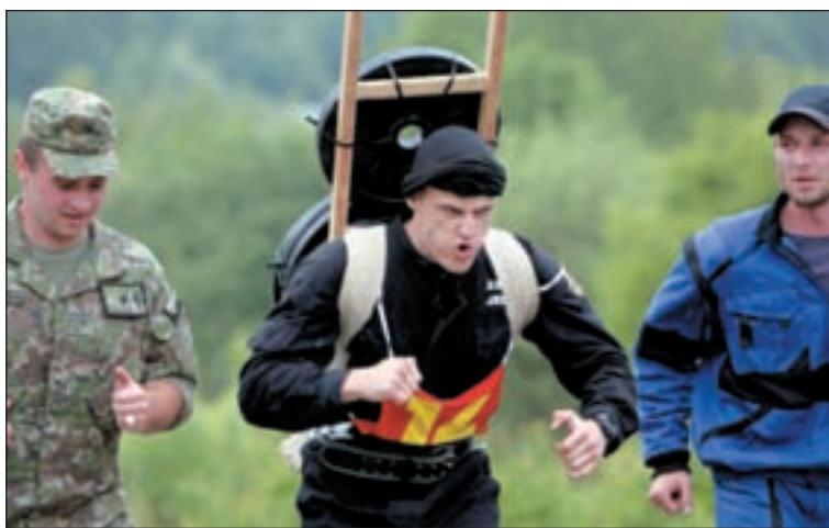
Koncom mája sa na Lešti konali hneď dve podujatia, na ktorých si reprezentanti silových rezortov mohli zmerať svoje svaly a schopnosti s kolegami z iných zložiek i zo zahraničia. Ministerstvo obrany už po deviaty raz zorganizovalo súťaž Železný muž roka, ministerstvo vnútra zasa siedmy ročník Medzinárodnej súťaže zásahových jednotiek krajín V 4. Príslušníci PZ sa nedali zahanbiť. Viac vo vnútri čísla.