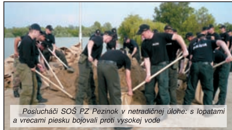
Poslucháči SOŠ PZ Pezinok v netradičnej úlohe: s lopatami a vrecami piesku bojovali proti vysokej vode

vodou zaplavené oblasti sme boli v podstate pripravení. Média online prinášali zábery z jednotlivých oblastí postihnutých povodňami. Ak nás však niečo v Komárne prekvapilo, boli to stovky miestnych občanov a občanov z blízkeho i ďalekého okolia, ktorí pod-