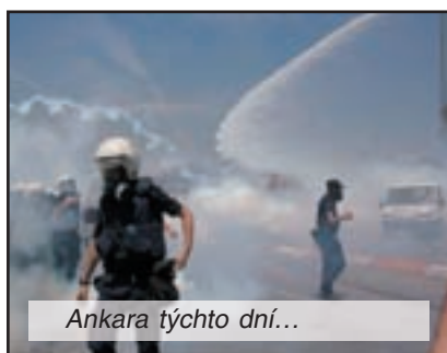
Ankara týchto dní...

už sme absolvovali prvé stretnutia s významnými reprezentantmi vrcholových orgánov EU. Teší nás, že im samým takýto dialóg v oblasti európskej policajnej agendy dosiaľ chýbal. My sa neponúkame ako nejaký nový šampón na trhu, chceme, aby nás bruselské špičky boli ochotné vypočuť, aby nás brali do úvahy a vnímali EuroCOP ako spolupracovníka pri rozhodovaní o veciach, ktoré majú dopad na pracovné a sociálne podmienky policajtov vo všetkých štátoch EÚ. Prvé úspešné kroky vnímame len ako začiatok, v októbri plánujeme workshop, kde by sme si tieto otázky podrobne rozobrali, potrebujeme sústrediť fakty a argumenty zo všetkých členských štátov, aby sme presne poznali situáciu, aby