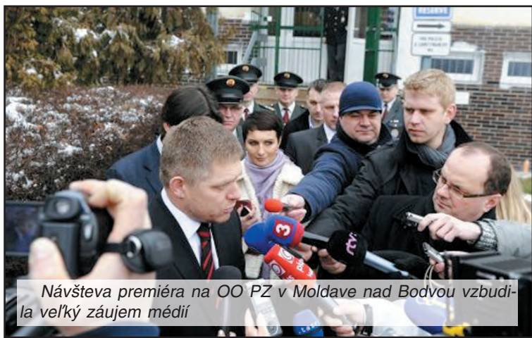
Návšteva premiéra na OO PZ v Moldave nad Bodvou vzbudila veľký záujem médií

rozpore s ľudskými právami, a potom tí policajti sú nám na nič. Preto chcem, aby policajti na Slovensku vedeli, že vláda Slo-