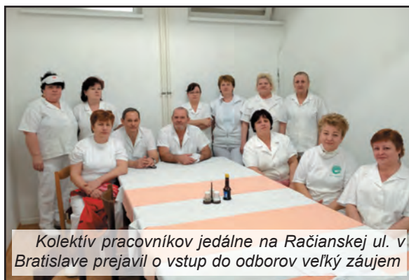
Kolektív pracovníkov jedálne na Račianskej ul. v Bratislave prejavil o vstup do odborov veľký záujem

vyššieho stupňa, pôsobila tu len rada zamestnancov. Ľudia tak prichádzali o množstvo benefitov, ktoré zmluvy garantujú ostatným zamestnancom MV SR, mohli sa vlastne oprieť len o Zákoník prá-