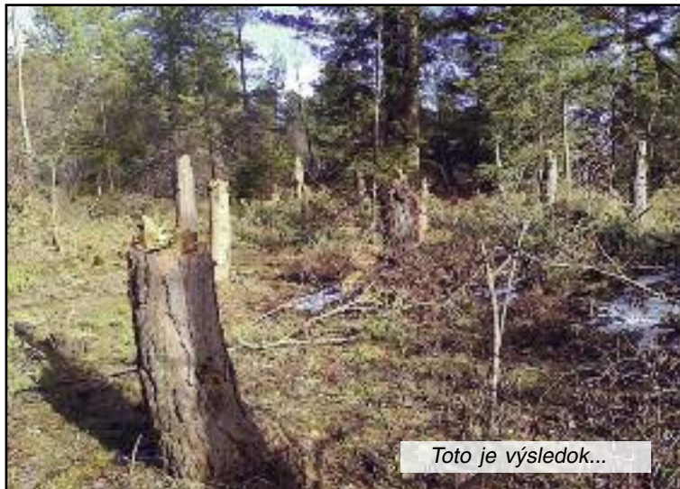
Toto je výsledok...

prizerať tomu, ako sa beztriestne devastuje lesná plocha? Prečo neexistuje úprava v trestnom zákone, ktorá by toto konanie sankcionovala? Z hľadiska prevencie a ochrany by to bola ohromná pomoc. Máme fotograficky zdokumentované, ako ubúda les v priebehu piatich rokov vi-