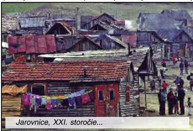
Jarovnice, XXI. storočie...

Pozvanie Všetkých tých, ktorí ma chcú súdiť za uvedené penzum názorov, postojov, stanovísk, konštatovaní a nedopovedaných, ale nad slnko jasných zvestovaní pozývam na osobnú obhliadku rómskych osád žijúcich na východnom Slovensku – a nielen na obhliadku. Dôležité je poznanie vnútorného mechanizmu fungovania takejto komunity: o tom, čo je tam považované za hodnotu, čo je cieľom týchto ľudí, porozprávame sa o ich snoch, o tom, čo je práve dnes dôležité, o tom čo je dôležité a životne dôležité v deň poberania sociálnych dávok, porozprávame sa s nimi o