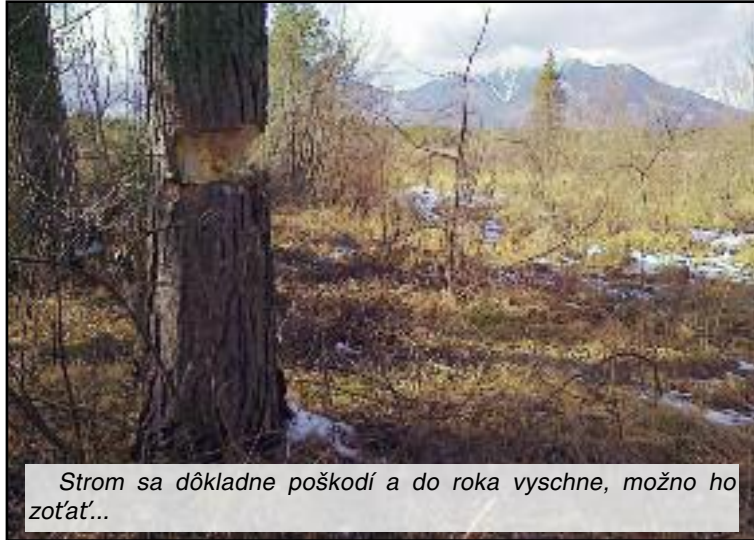
Strom sa dôkladne poškodí a do roka vyschne, možno ho zoŕať...

už nepostihuje toho, kto takúto drevinu poškodí devastujúcim invazívnym spôsobom. Po nespočetných akciách v lesných porastoch pod Tatrami v spoločnosti zamestnancov TANAP-u môžem zodpovedne povedať, že v Tatrách v blízkosti rómskych osád je zarúbaný každý druhý strom. Takéto konanie náš zákon nepostihuje? Prečo? Prečo sa máme len