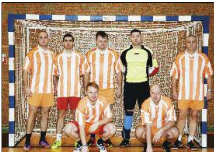
Družstvo michalovských odborárov obsadilo 3. priečku

Domov si naši hráči doniesli pohár za 3. miesto a každý hráč