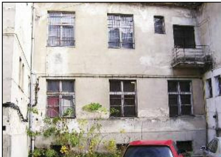
Kuriozitou sú zamurované dvere na balkónik...