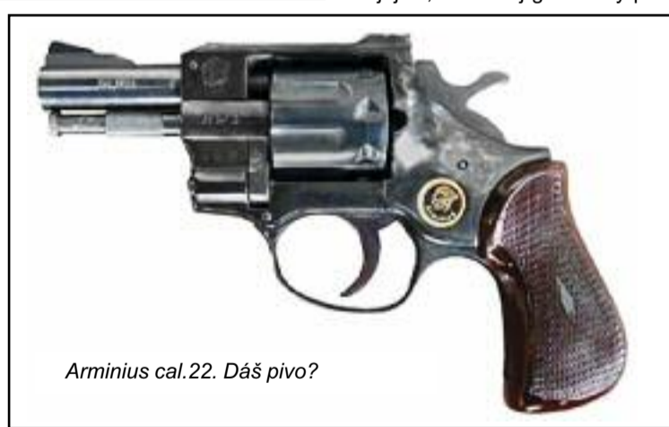
Arminius cal.22. Dáš pivo?

Čisto subjektívne si dovoľím tvrdiť, že dotčný 42-ročný muž s 1,92 promile obišiel na súde veľmi, ba až šokujúco dobre. Prokurátor mlčal ako ryba a rozsudok sa tak stal právoplatný, potvrdila Adriána Vašková, hovorkyňa