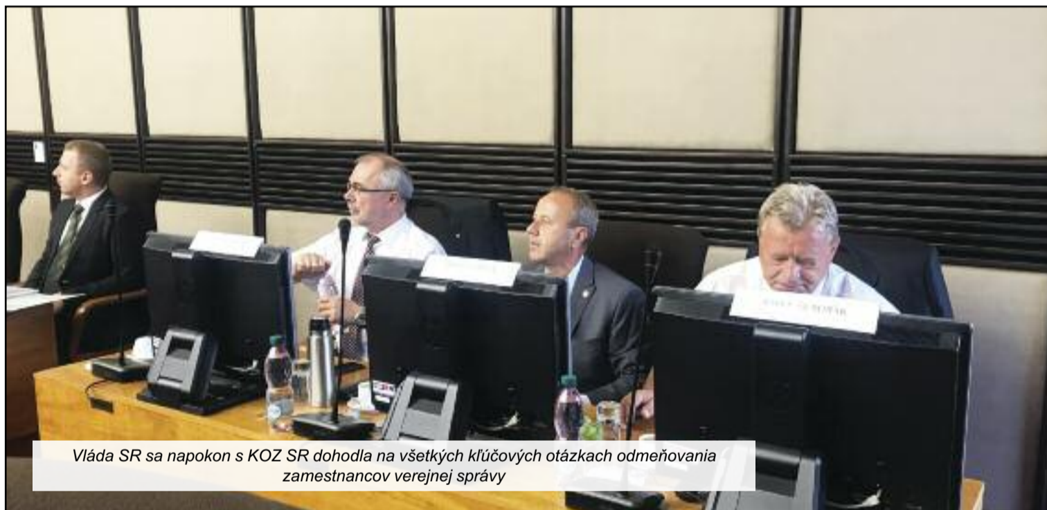
Vláda SR sa napokon s KOZ SR dohodla na všetkých kľúčových otázkach odmeňovania zamestnancov verejnej správy