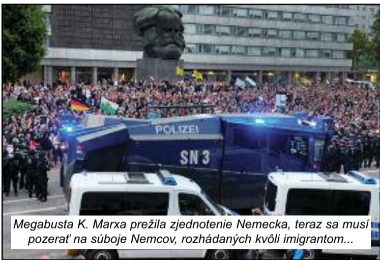
Megabusta K. Marxa prežila zjednotenie Nemecka, teraz sa musí pozerať na súboje Nemcov, rozhádzaných kvôli imigrantom...

Dve skupiny ľudí, ktorých počet narástol na niekoľko tisíc, oddeľovali stovky policajtov, protesty aj tak prerástli do vzájomných potýčiek, kde lietali kamene, svetlice a všetko, čo na uliciach nebolo pripevnené. Polícia na rozohnanie demonštrantov napokon použila aj vodné delá, nepokoje však trvali viac dní. Hoci polícia