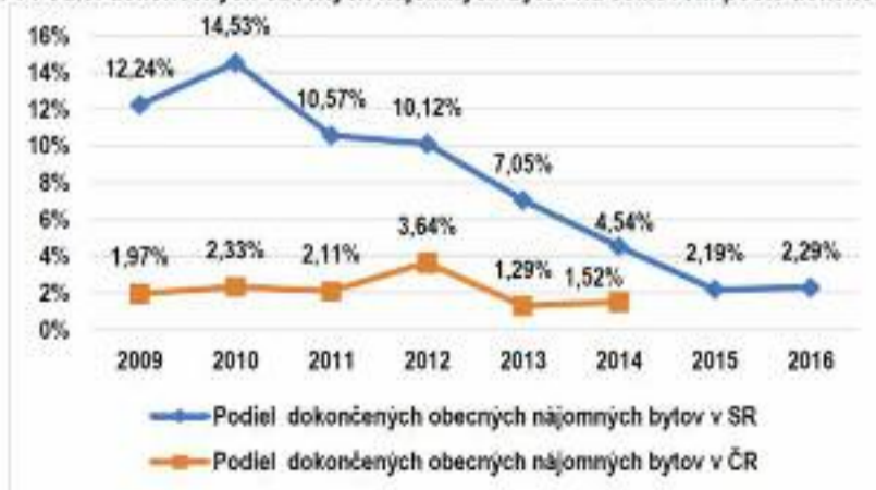
Obr. 1 Podiel dokončených obecných nájomných bytov na celkovom počte dokončených bytov v SR a v ČR