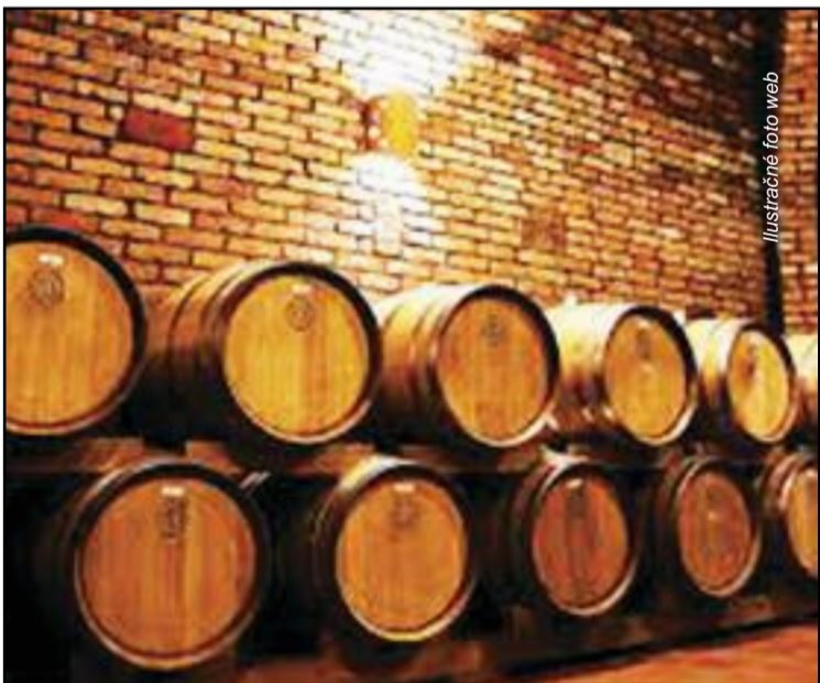
Ilustračné foto web

Moravou v čase, ktorý najviac praje zlatistému moku pod Pálavou.