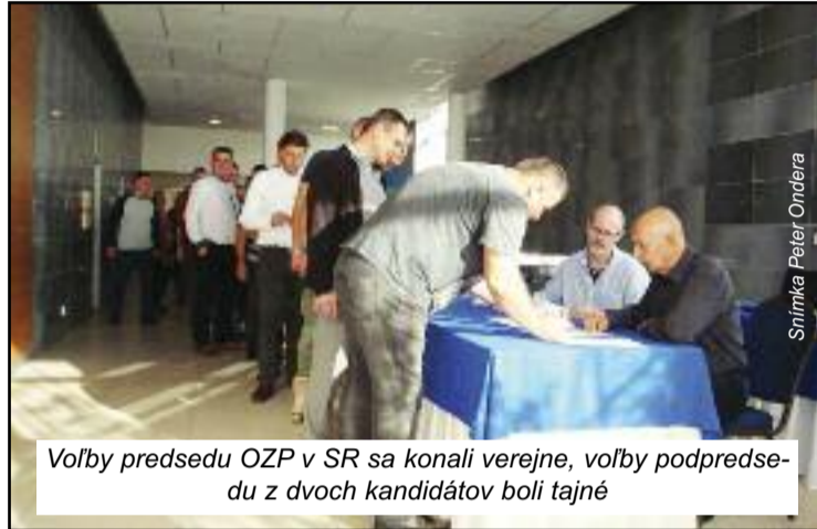
Voľby predsedu OZP v SR sa konali verejne, voľby podpredsedu z dvoch kandidátov boli tajné