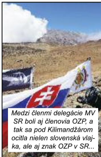
Medzi členmi delegácie MV SR boli aj členovia OZP, a tak sa pod Kilimandžárom ocitla nielen slovenská vlajka, ale aj znak OZP v SR...