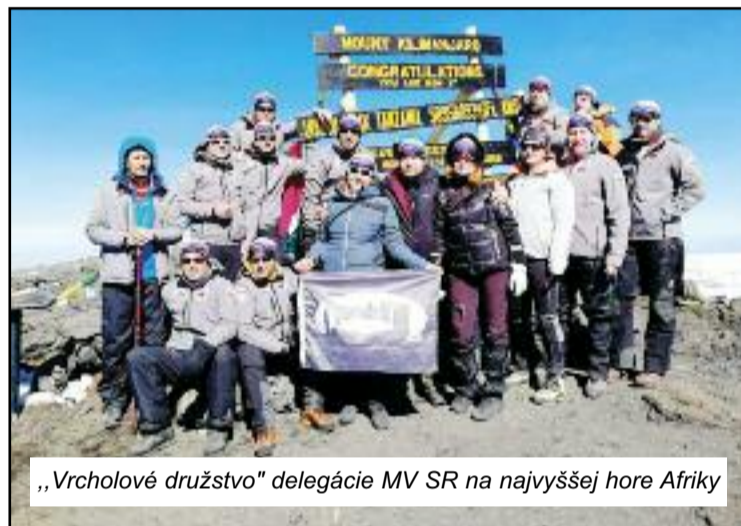
„Vrcholové družstvo“ delegácie MV SR na najvyššej hore Afriky

zabezpečená na náklady pozývajúcej strany 26 - miestnym autobusom a sprevádzaná policajnou eskortou - motorkou a špeciálnym sprievodným vozidlom pre ochranu zahraničných delegácií. Prijatie prebehlo na najvyššej cirkevnej úrovni, vzhľadom na to že v danej chvíli bol vedúcim delegácie MV SR riaditeľ úradu EPS MV SR. Popoludní sme boli ubytovaní v hoteli, nasledoval krátky odpočinok a následne nás zahraničná strana zobrala na malú obhliadku mesta. Mesto Dar es Salaam, v ktorom sme bývali, má 6,5 milióna obyvateľov a je hlavným ekonomickým centrom krajiny. V nedeľu sa delegácia MV SR zúčastnila evanjelických služieb Bo-