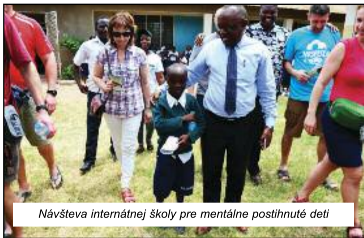
Návšteva internátnej školy pre mentálne postihnuté deti

nej spolupráce štátu a cirkvi v rámci ministerstva vnútra.