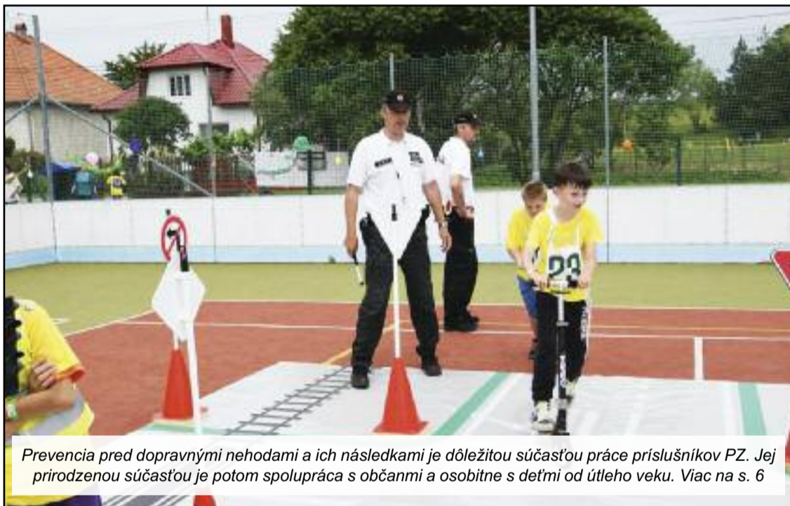
Prevenencia pred dopravnými nehodami a ich následkami je dôležitou súčasťou práce príslušníkov PZ. Jej prirodzenou súčasťou je potom spolupráca s občanmi a osobitne s deťmi od útleho veku. Viac na s. 6

každým dňom, kým budú naši členovia čítať tieto riadky, všeličo môže byť inak. /rozhovor sa uskutočnil 12. 3., pozn.red./ Isté je, že potrebujeme policajtov čo najrýchlejšie zodpovedne informovať, lebo je tu obrovské riziko, že sa spustí lavína odchodov, a to by sme už vnímali ako pokus o ohrozenie vnútornej bezpečnosti štátu, o ktorej sa hovorí, že síce nie je najdôležitejšia, ale bez nej v štáte nefunguje nič. Pri všetkej úcte, obranyschopnosť štátu je dôležitá vec, ale v mierovom stave je zodpovednosť za pokojný život obyvateľov tohto štátu na policajných silách. Po rokovaní vlády ma ministerka uistila, že členovia vlády, ktorí majú čo do toho ešte hovoriť (predseda vlády, minister financií) ubezpečili, že navýšovanie platov ako motivačný prostriedok pre získanie príslušníkov či už MO SR, PZ alebo ZVJS umožnia len vtedy, ak to pôjde koordinovane v spoločnom kontexte vo všetkých rezortoch. Minister obrany, ale aj ďalší predstavitelia strany SNS vyhlasujú svoje predstavy a návrhy do budúcnosti bez ekonomickej analýzy a dohody s ostatnými koalíčnými stranami. Je to neštandardný postup a následne vyhlásenia upravujú a menia ale (Pokračovanie na strane 2)