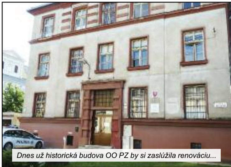
Dnes už historická budova OO PZ by si zaslúžila renováciu...

ganizácie v rámci OR PZ v Liptovskom Mikuláši?