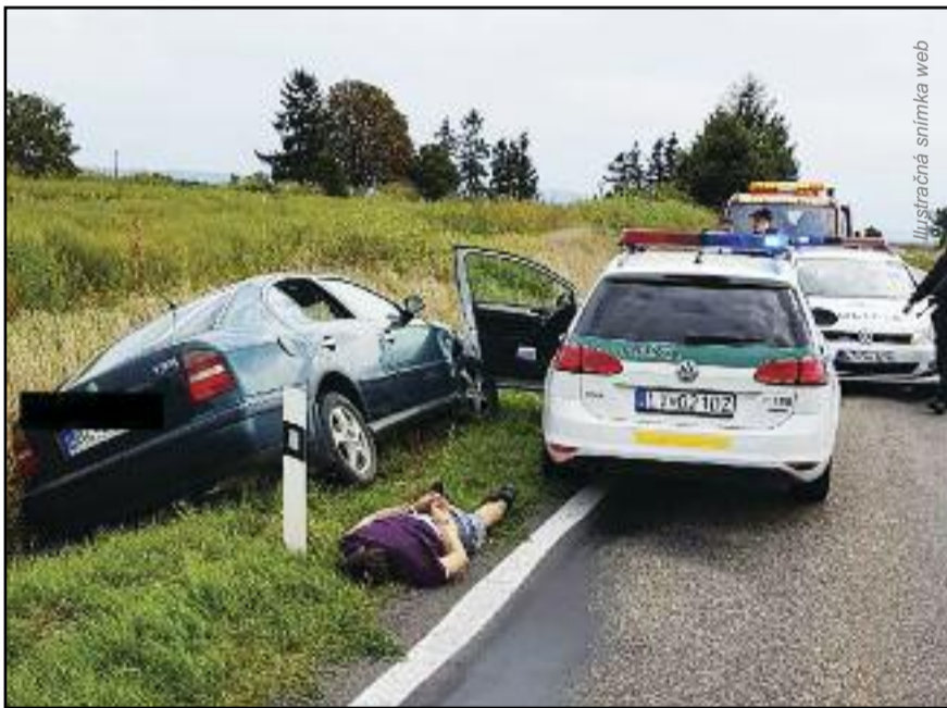
Ilustračná snímka web

Pozn. red.: Vzhľadom na závažnosť dopadov tohto verdiktu ESLP aj na prebiehajúce trestné konania v SR redakcia uvíta diskusiu k tejto téme.