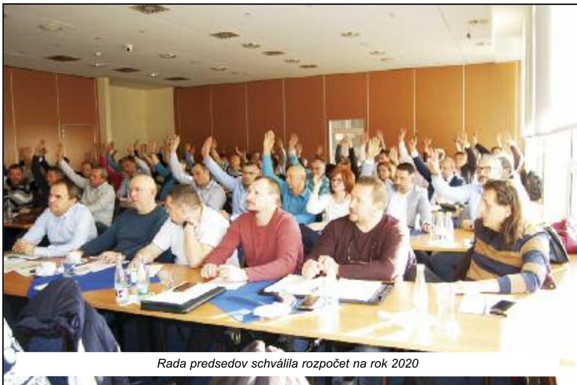
Rada predsedov schválila rozpočet na rok 2020