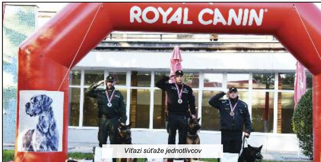
Vítazi súťaže jednotlivcov