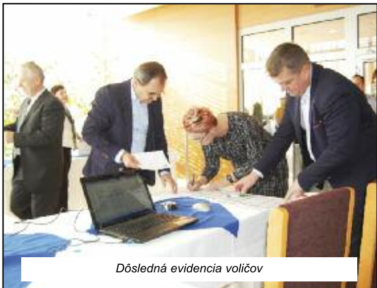
Dôsledná evidencia voličov