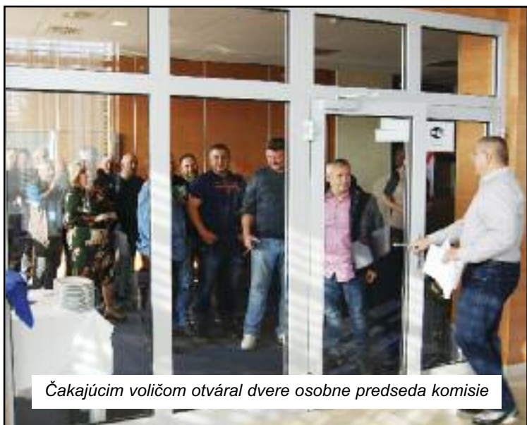
Čakajúcim voličom otváral dvere osobne predseda komisie

čov zo 100, na zvolenie postačovala prostá väčšina hlasov, v prípade rovnosti hlasov by v zmysle