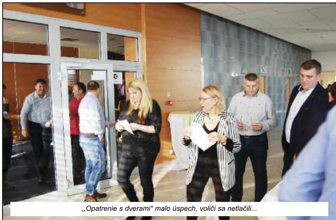
„Opatrenie s dverami“ malo úspech, voliči sa netlačili...